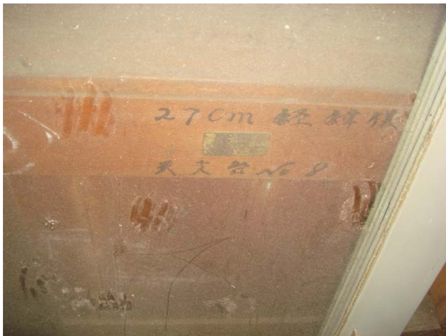
写真1 27cm 経緯儀と書かれた木箱

またまた、基線尺倉庫を漁った。今回は当ても無く探索に入ったわけではない。先日プラン子午儀を発見した際、奥の棚に「27cm 纏経緯儀」と書かれた木箱（写真1）を見つけていた。奥まった所にあり、すぐには手をつける気にならなかったのを、意を決して調べてみようと思った。