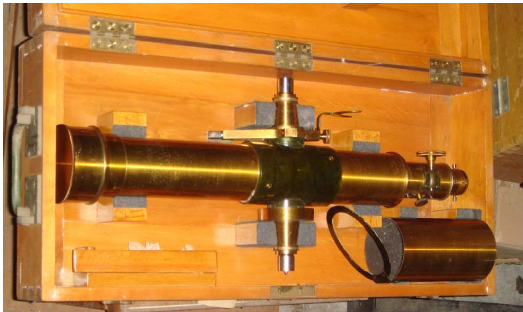
写真4 金色の輝く 27cm 経緯儀望遠鏡鏡筒部

もまた、金色に輝く鏡筒だ。こうして発見されるお宝の多くはこのように「金色」に輝いて発見されるのである。