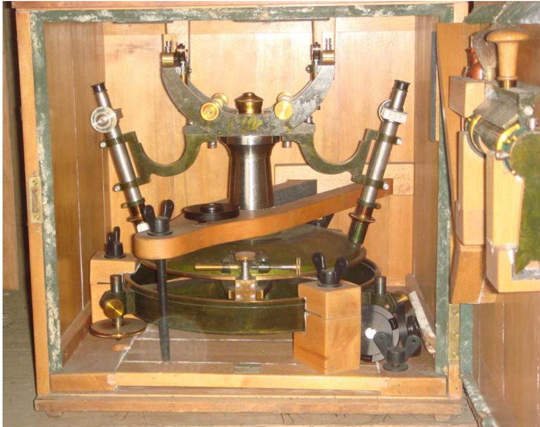
写真2 見つかった27cm 経緯儀の架台部

この架台部分の入った木箱は棚の西端の一番下の段にあった。棚の近くを探索すると、この木箱のあった場所から1区画奥の2段目の棚に細長い木箱が2個あることを発見した。まず上の木箱を開いてみた。どうも違うようだ。そこでその下のもう少し大きく長い箱(写真3)を引きずり出した。表書きにまさにそのものが書いてあった。