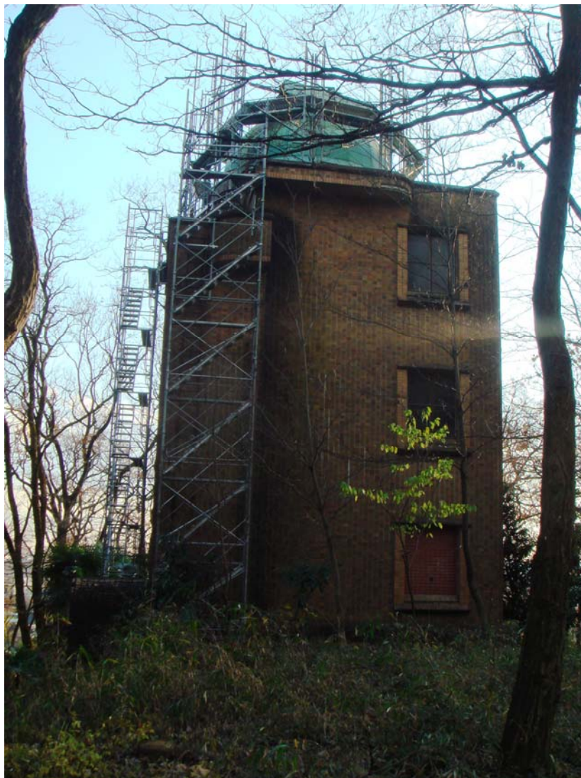
写真4 2009年の雨漏り工事中の塔望遠鏡の建物

え回復すれば除湿機を働かせて、この建物の有効利用が出来ると考えている。現在は電気が止められる前に持ち込まれた日食用の梱包木箱が山と積まれている。荒果てた建物の中の掃除は容易ではない。写真4が現在の足場が組まれた塔望遠鏡の姿である。