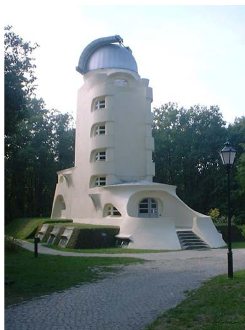
写真2 ドイツのアインシュタイン塔

この記事によると、半地下の分光器室はすでに完成していて、この報告は分光器室の南側の5階建ての塔部分についての報告である。この写真で見ると半地下の分光器室の上には土盛りがあり、塔部分にも足場などなく工事が終り完成している。