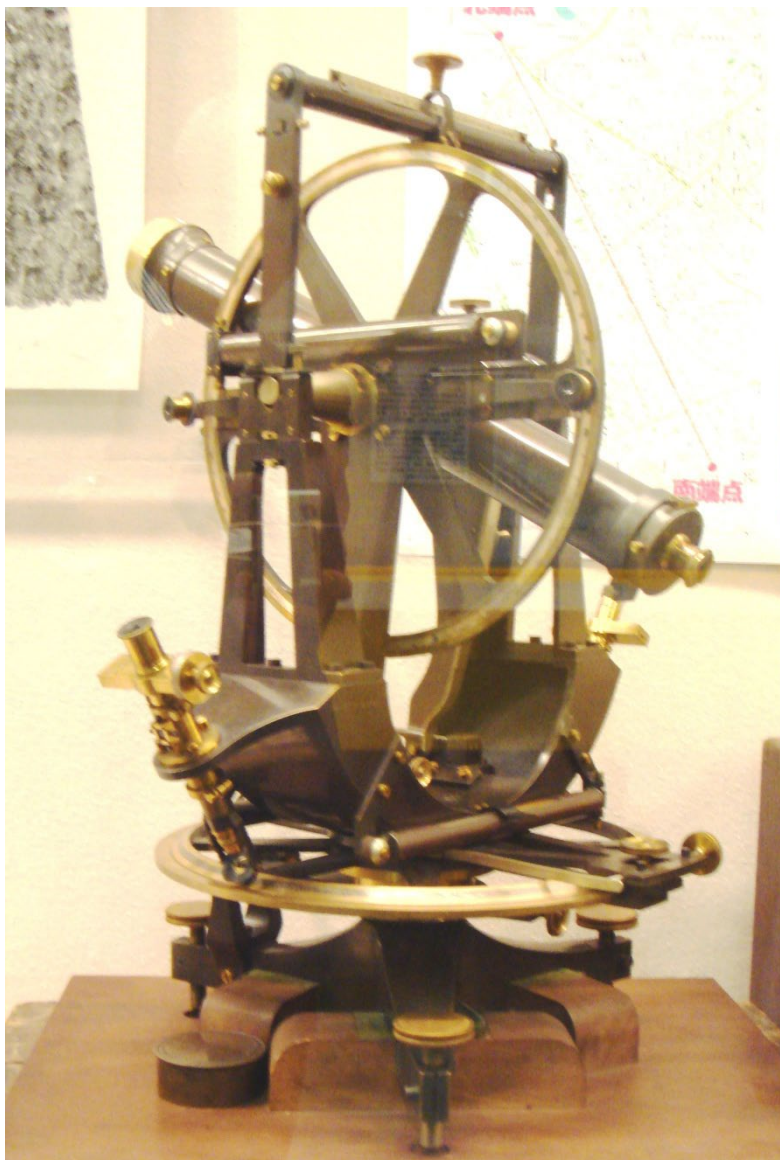
写真2 国土地理院に展示された12吋トロートン・シムス経緯儀

国土地理院の記録によるとこの経緯儀は明治7年（1874年）に購入されたとあるそうだから、製作年はそれ以前ということになり、水沢、三鷹にある1875年製のものよりは古いことは確かである。