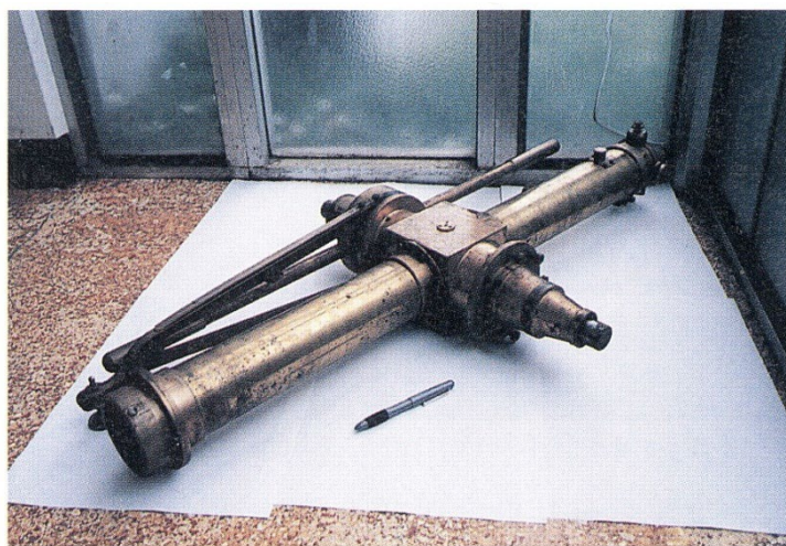
写真1 発見された24吋経緯儀の一部

国立天文台天文情報センターにアーカイブ室が置かれた当初の頃、アーカイブ室新聞第3号に「水沢にもあった 1875年製トロートン・シムス経緯儀望遠鏡」という記事を書いた。トロートン・シムス経緯儀についてはいくつもの記事を書いてきた。それは東京天文台(国立天文台の前身)で1975年製の望遠鏡の一部(写真1)が発見され、それが子午儀として仮復元されていたものを、筆者が子午儀ではなく、24吋経緯儀の一部であることを突き止めたことに端を発している。