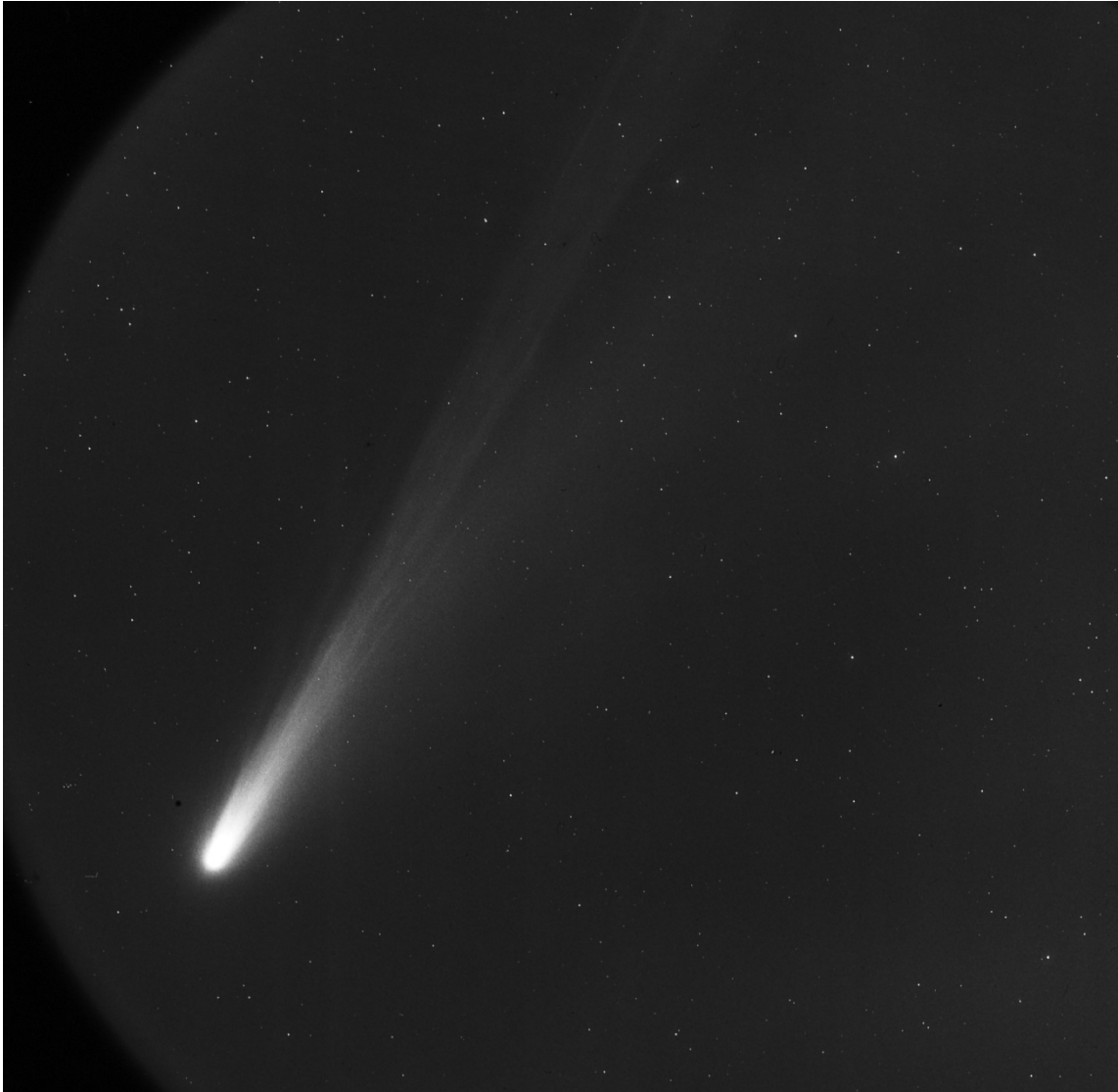
写真4 No. 2378 (1976年3月8日のWest 彗星)