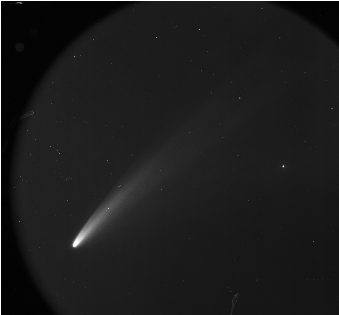
写真5 No. 2372 (1976年3月5日のWest彗星)