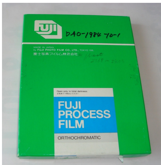
写真1 シートフィルムの入っていた箱

図書室からアーカイブ室の筆者に渡された中に FUJI PROCESS FILM の箱(写真1)があり、その中には堂平観測所の 50cm シュミット望遠鏡で撮影された West 彗星の乾板をシートフィルムに転写したポジフィルム 17 枚(写真2)が入っていた。この 17 枚の天体写真をデジタルデータとして収蔵した。スキャナーの都合で写野全体は取り込めていないがほぼ全体とっていい。その天体写真の一覧が写真3である。