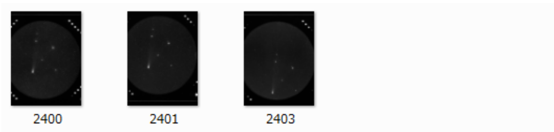
写真3 取り込んだ17枚のWest彗星像一覧