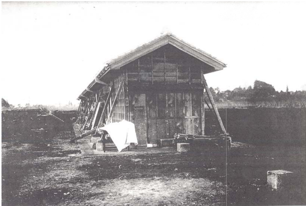
写真 5 菱形基線尺試験室の間口から撮影されたもの