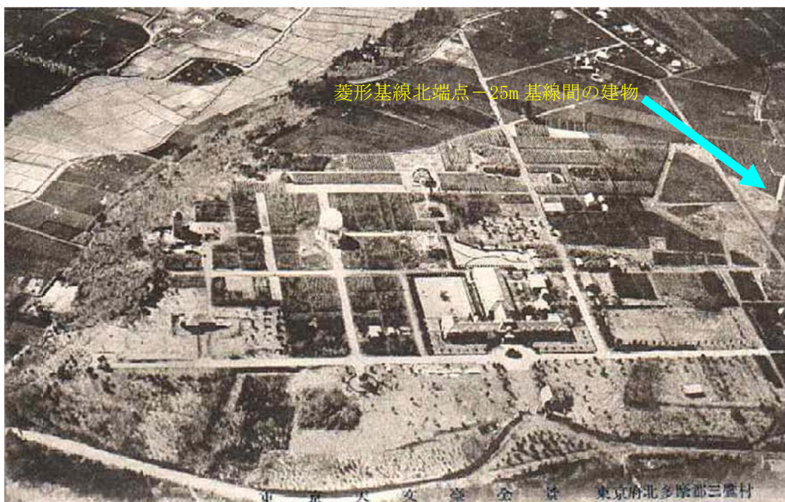
写真1 菱形基線北端点-附属点間の建物の写っている航空写真

アーカイブ室新聞第137号(2009年2月19日)に「基線尺試験室の写真発見(菱形基線北端点-25m比較基線の建物)」という記事を書いた。これはその頃、基線尺の測定に来ていた国土地理院の方から菱形基線尺試験棟の写真を入手した記事である。アーカイブ室新聞137号に掲載した1932年当時の東京天文台の航空写真が写真1である。この写真の中に青い矢印で示した建物が菱形基線尺試験棟である。また、アーカイブ室新聞147号(2009年3月6日)に「幻覚か! 国立天文台にピラミッド型屋根が5つあった」(菱形基線尺試験室の基礎、基線尺台などを発見)という記事を書いた。これらの記事の元になった菱形基線尺試験棟の写真3枚が国立天文台の旧図書館の雑然と置かれた古い写真乾板の中から発見されたのである。