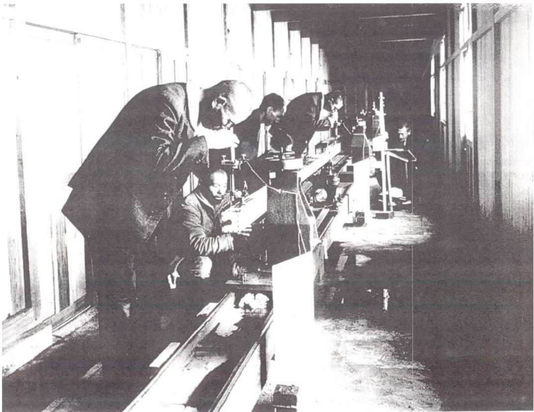
写真7 菱形基線尺試験室の建物の内部での測定の様子