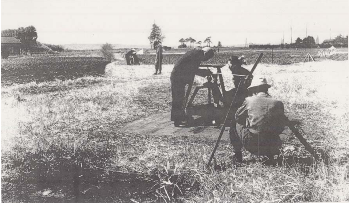
写真8 菱形基線東端点－南端点間の屋外測定の様子