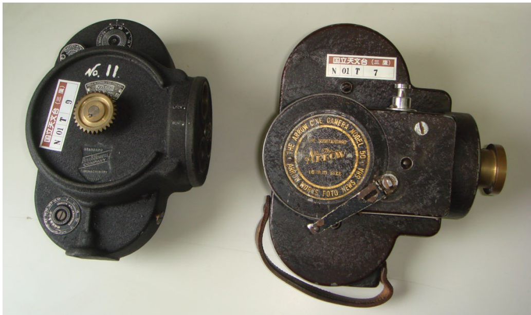
写真1 16mm 撮影カメラ

の2点があった。写真1の左がBELL & HOWELL、右がCINE ARROW。