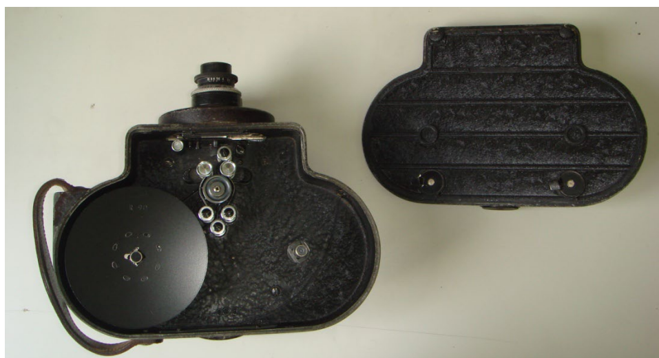
写真7 フィルムを装填する蓋を外したところ

これらアーカイブ室新聞の記事にお気づきのことがあれば、編集者中桐にご連絡いただければ幸いです。中桐のメールアドレスは、 arcnaoj@pub.mtk.nao.ac.jp