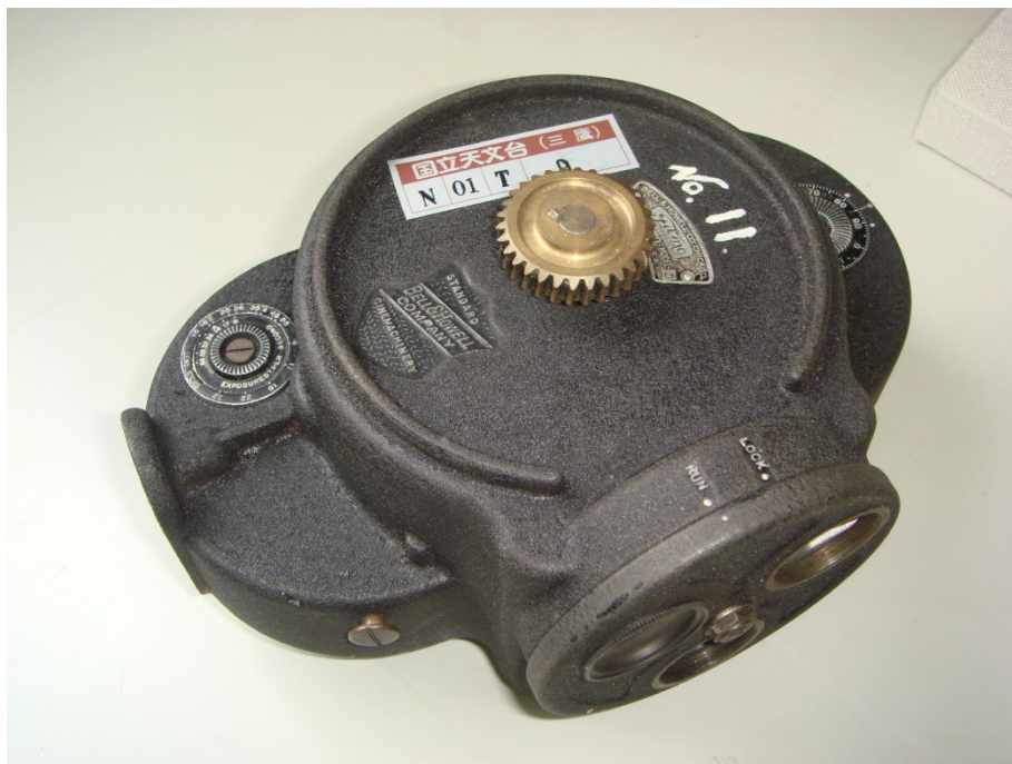
写真 4 BELL&HOWELL のカメラ 残念ながらレンズがない

BELL & HOWELL のカメラの全体写真が写真 4、その蓋を外したところが写真 5 である。