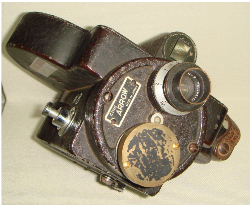
写真6 CINE ARROW 社のカメラの全体像