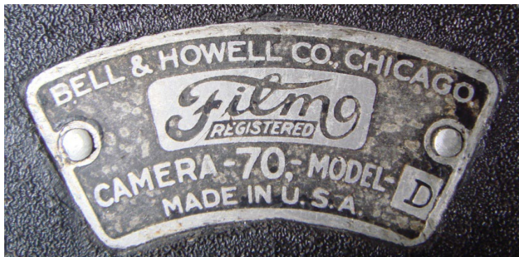
写真2 BELL & HOWELL の名盤

BELL & HOWELL 社のカメラは残念ながらレンズがない(写真4)。シカゴの会社ということが名盤から読める。名盤が写真2、3である。