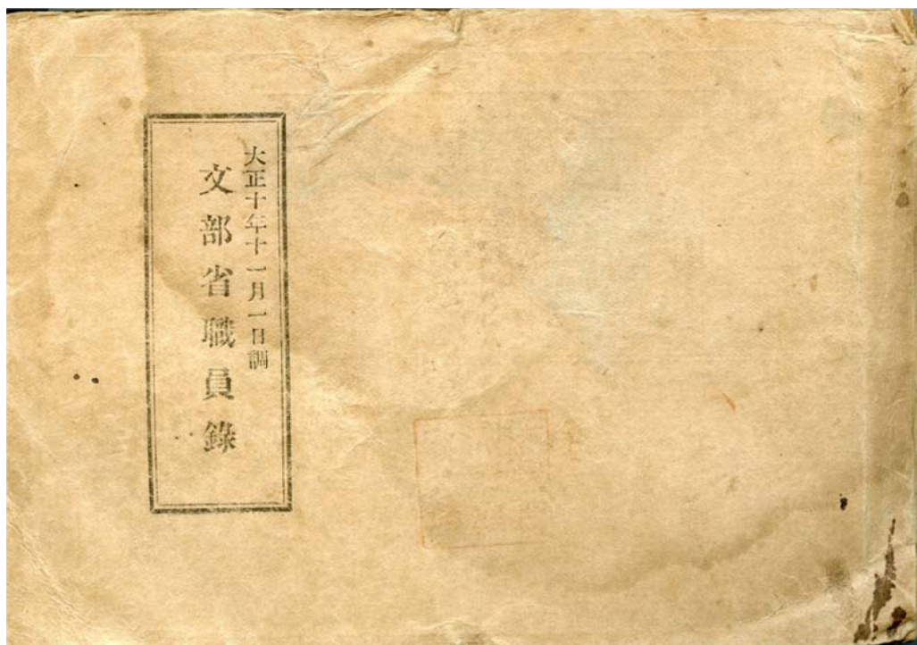
写真1 大正10年の文部省職員録

2013年1月23日～24日に2日間、水沢 VLBI 観測所に国立天文台博物館構想の話し合いに出かけた。アーカイブ室の発展形態として国立天文台博物館構想を進めている一環で、水沢 VLBI 観測所もこの構想の一員になることが検討されており、その打ち合わせに行った。その際、木村記念館、奥州宇宙遊学館（木造の旧本館）、旧図書室などを見せていただいた。水沢 VLBI 観測所の前身である緯度観測所は、国立天文台の中で現存する一番古い観測所の一つであり、1899年（明治32年）に発足している。さすがに100年を超える歴史ある観測所で貴重な歴史的観測機器類、資料などが山とある。旧図書室の建物は耐震化工事も終わっており、国立天文台博物館水沢分館としてすぐにも使用できる建物である。この建物の資料のうち、今回紹介するものは大正10年(写真1)、11年(写真2)の文部省職員録である。特にこの2冊を選んだのは、この間に東京天文台が理学部付属から、大学附置に変わっていたからである。