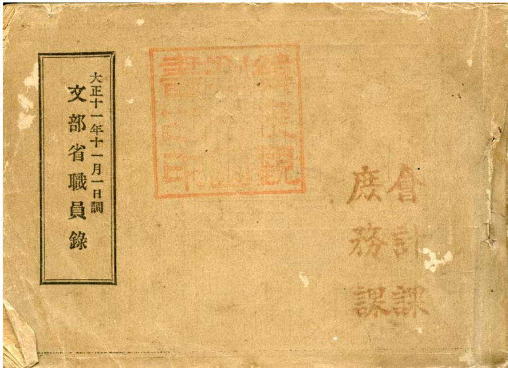
写真2 大正11年の文部省職員録