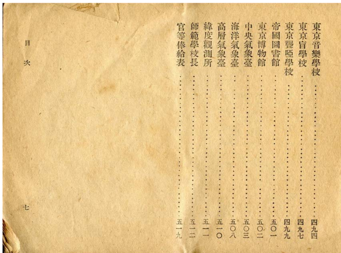
写真6 緯度観測所が登場する目次の最後のページ