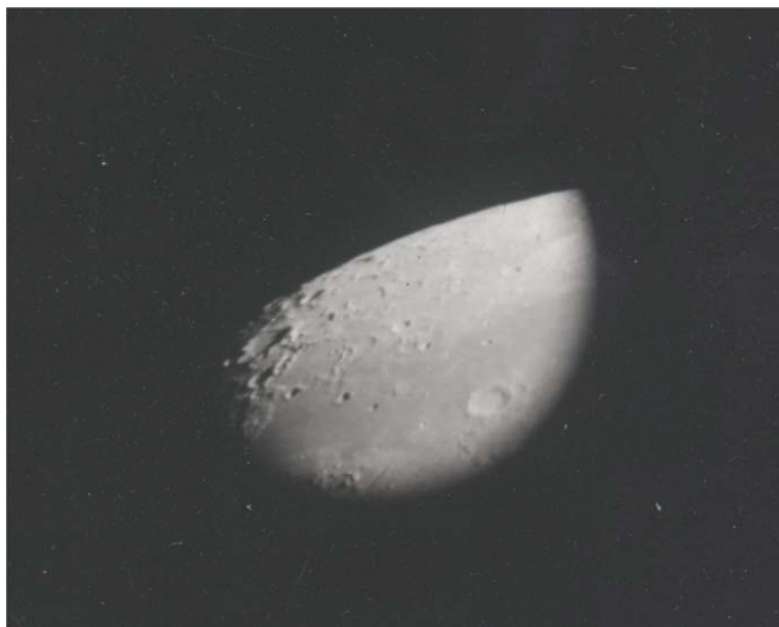
写真6 4枚目の乾板の月の拡大写真