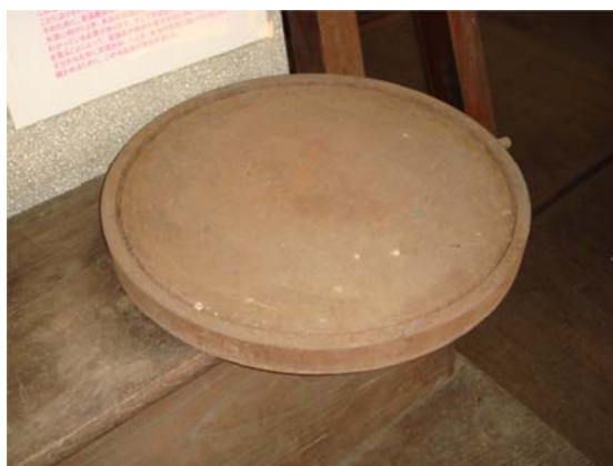
写真2 レプソルド子午儀用水銀盤

ゴーチェ子午環用水銀盤はゴーチェ子午環観測室に敷かれたレール上を走るための車輪がついている。レプソルド子午儀用水銀盤は盤のみであった。今回発見された水銀盤は大きな写真用バットの中にあり、さらに大きなバットが被せられていた。