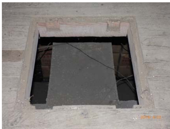
写真 7 ハッチを開いたところ

したがって、この水銀盤がどのように設置され、使用されたかわからないが、水銀盤の性質上、精密に水平にするような設置台は必要としないことは当然である。