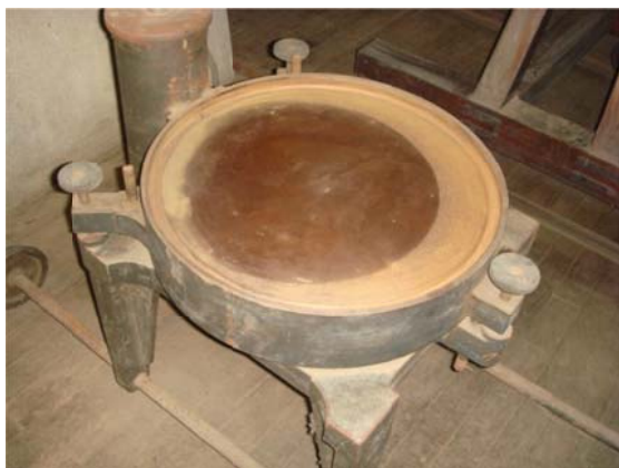
写真1 ゴーチェ子午環用水銀盤

なぜゴーチェ子午環用の水銀盤(写真1)がレプソルド子午儀室にあるのか不思議であった。レプソルド子午儀室にはレプソルド子午儀用の水銀盤(写真2)があった。