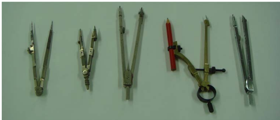
写真3 先人の遺品のコンパス類

これらも、もはやほとんど使う場がなくなってしまった。この類の文房具に円を描くコンパスというものがあつた。先人の遺した文房具の中にも大概入っていて、筆者の引き出しには写真3のように何本もある。