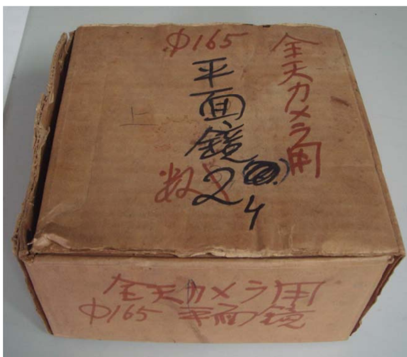
写真1 平面鏡5枚が入っていた箱

Φ165、全天カメラ用平面鏡数枚と書かれた段ボール箱（写真1）を発見した。この段ボール箱には他にフォトマル（光電子増倍管）2本、ニコンFモータードライブカメラ（レンズなし）、モータードライブコントローラらしきものが入っていたが、これらについては稿を改める。