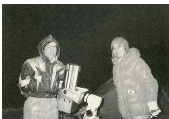
写真 4 観測準備光景

シア日食では礮部の観測は失敗で F コロナについての良い結果は得られなかった。F コロナは太陽から太陽半径の 4 倍の距離にできるダストリングが太陽の光を反射して見えるものだというのである。礮部隊が観測地に選んだメキシコのポポカテペトル山は標高 5452m の