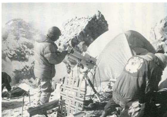
写真 3 観測光景-1

太陽近傍のダストリングは F コロナの観測は、1983 年 6 月 11 日のインドネシア・ジャワ島で気球の搭載された測光偏光観測装置によって行われた報告もある。しかし、インドネ