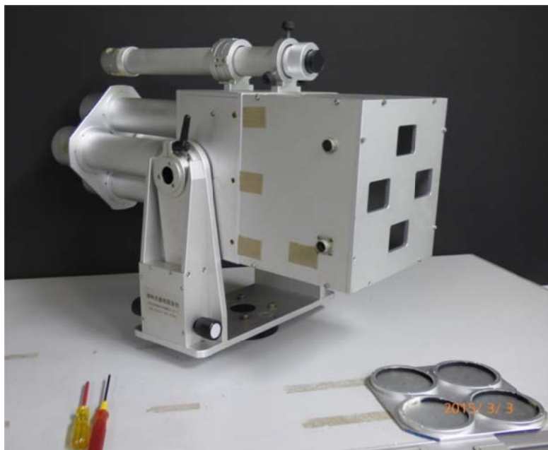
写真 2 偏光撮像装置を後ろから撮ったところ

この観測装置はなかなか美しい姿をしている。制作したのは東京・府中の神和光機である。写真 2 が後ろから撮影した観測装置であるが、後部の四角な箱の中には CCD カメラが入っていたはずであるが撮像装置らしきものは残っていない。日食などに使用された観測装置が観測当時の現状を保って保存されることはほとんどなく、各部がその後の観測に有効利用されるからである。それでもこの 4 連偏光撮像装置は外観をとどめて保存されていた。むしろ珍しいことである。