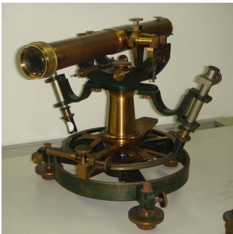
写真5 今回収蔵した27 cm一等経緯儀