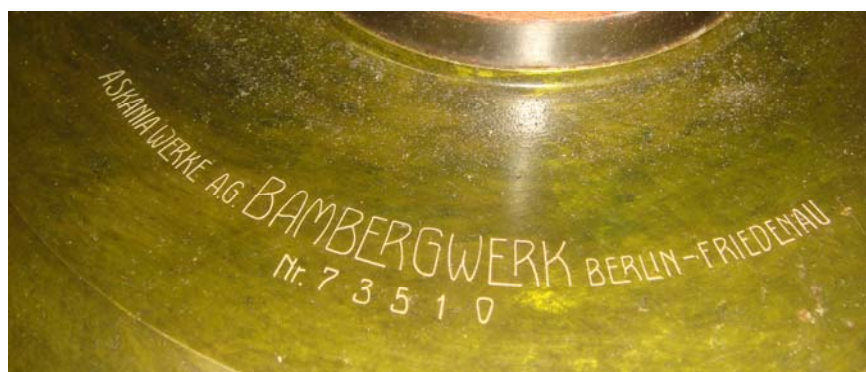
写真2 27 cm一等経緯儀の刻印