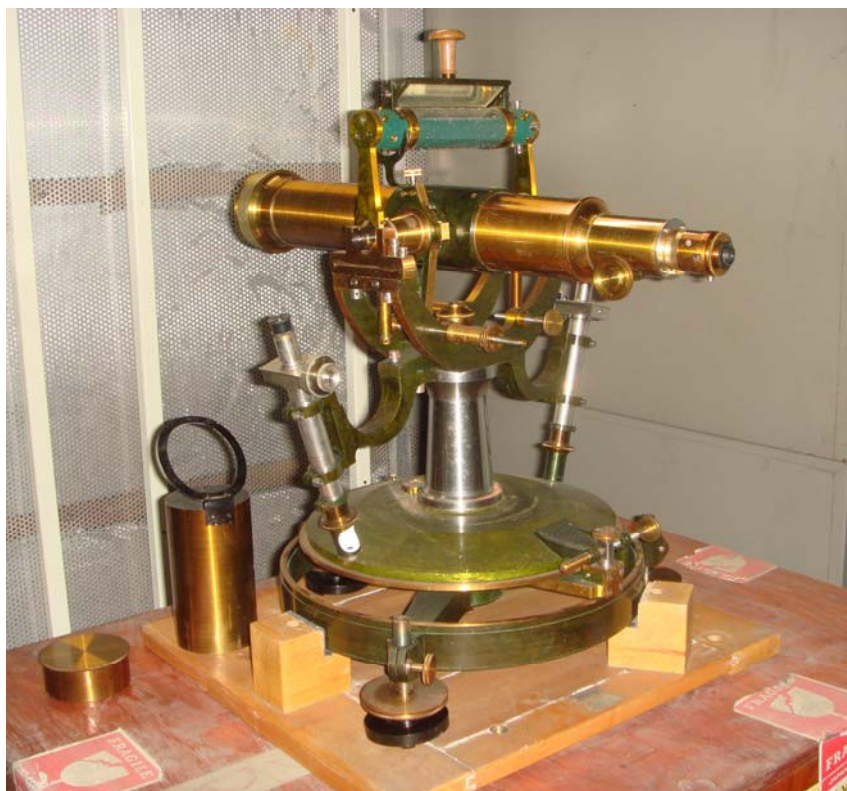
写真1 国立天文台で発見された 27 cm一等経緯儀 写真2 がその刻印である。

アーカイブ室新聞第87号(2008年10月29日)に「27 cm経緯儀発見」という記事を書き、第88号(2008年10月30日)に「27 cm経緯儀を天文台プレミアムに搬入、復元、展示」という記事を書いた。この27 cm一等経緯儀が写真1である。