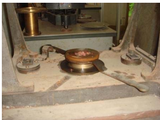
写真 7 動き始めた上下機構

この子午儀には、明らかに東西反転機構が着いているように見えるのだが、その機構は頑として動かなかった。2008 年 5 月 23 日、意を決して整備しようと子午儀資料館に行き、ここぞと思うところに潤滑剤を注入しながら、分解して行った。優に 130 年以上を経た器械だし、多分 100 年は動かしたことの無い機械であるが、少しでも動き始めれば大丈夫という自信があった。それは 30mm 経緯儀を分解し動くようにした経験からであった。それと思うところに潤滑剤をくれてやり、力自慢の腕に渾身の力を込めてレバーを引くと僅かに回転した。少し動けば大丈夫！上下機構は動くようになり、潤滑剤を注入しながら何度もなじませると 100 年を経た器械とは思えないほど上下機構はスムーズに動き始めた。