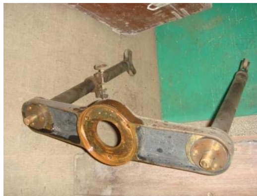
写真 8 東西反転機構