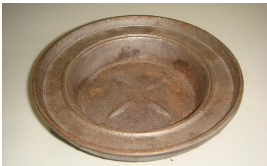
写真 3 ドーム屋根を外せばただの灰皿