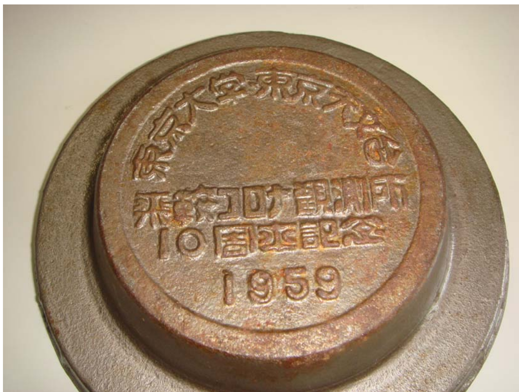
写真 2 記念品の灰皿の裏面に刻まれた文字 ドーム部を外せば、何の変哲もない灰皿(写真 3)になってしまう。

裏面には、東京大学東京天文台乗鞍コロナ観測所 10 周年記念 1959 の文字(写真 2)が読める。