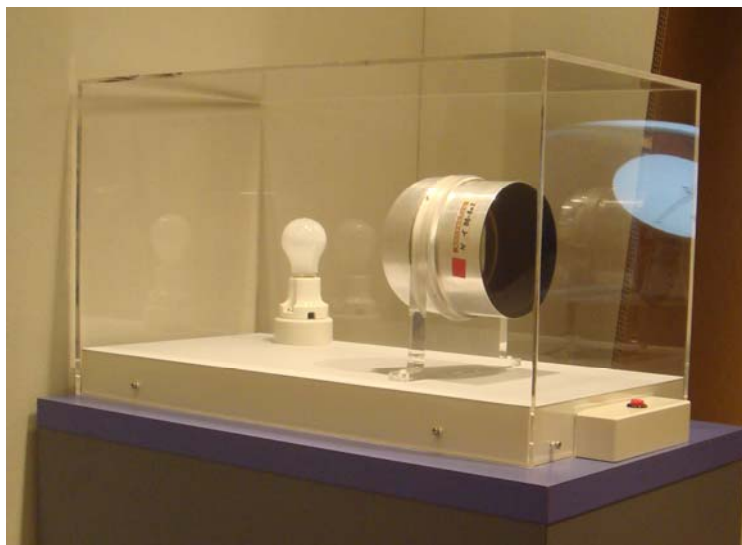
写真2 展示ケースに入った透過グレーティング

2009年5月30日から始まる日本天文学会創立100周年・世界天文年2009の企画展、ガリレオの天体観測から400年「宇宙の謎を解き明かす」という巡回展示にアーカイブ室所蔵の「透過グレーティング」が出品される。アーカイブ室所蔵のものでは他に、日本の時刻を決定する観測に使われていた90mmバンベルヒ子午儀も展示されるが、子午儀については項を改める。