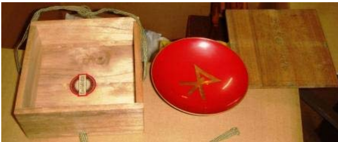
2) 三々九度杯 (3 個組み) 福、徳、寿