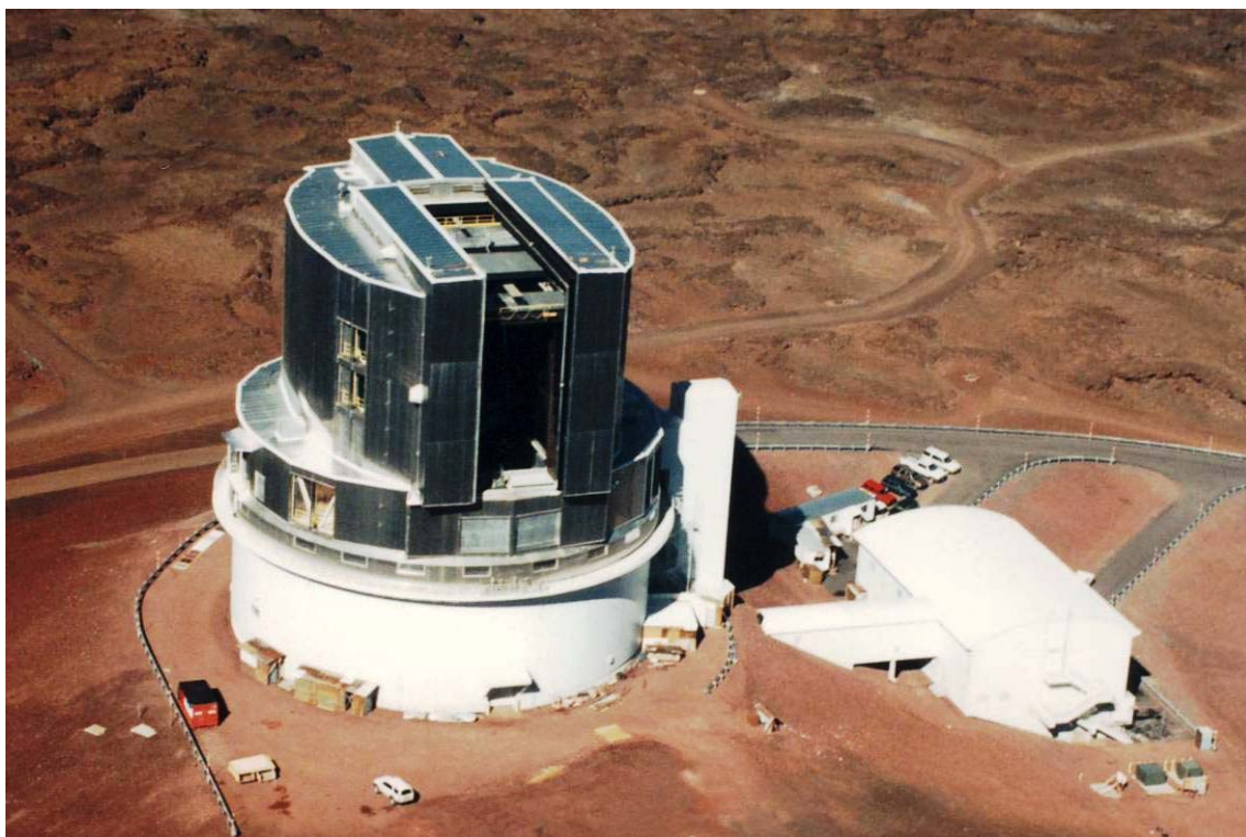
写真 2 完成した大型光学赤外線望遠鏡「すばる」のドーム

国立天文台が設立されたのは 1988 年 7 月 1 日であるから、まだ東京天文台時代である。当時は、JNLT (Japan National Large Telescope) と言っていたハワイに建設された大型光学赤外線望遠鏡「すばる」計画の取材記事である。新聞記事のイラストは、ハワイ島マウナケア山頂に完成した「すばる」とはまるで違った姿に描かれている。これは取材記者がでたらめを書いたわけではない。当時はこのイラストのように丸いドームの中に経緯台式の 7.5m 望遠鏡を考えていたのである。検討から 20 年以上、建設に 10 年近くの年月を要した大型計画は、最高の性能を追求することを続け、ドームは丸い半球型から円筒形のドームに変わり、最良のシーイングを得るために望遠鏡の前後通風の大きな開口、左右に 4 か所のフラッシング窓と呼ぶ自然の風を通すおおきな通風口をもったドームの完成時の姿は写真 2 のようであった。