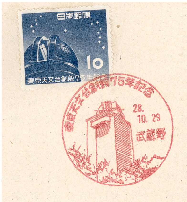
写真 2 記念切手と初日スタンプ

東京大学東京天文台は、明治 11 年(1878 年)東京大学観象台として発足した時点を開始点としており、昭和 28 年(1953 年)10 月 29 日に 75 周年記念式典を、そして昭和 53 年(1978 年)に 100 周年記念式典を行った。東京大学東京天文台は、発展的に改組が行われ国立天文台と名前を変え、132 年を迎えている。