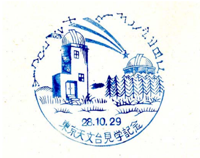
写真 3 東京天文台見学記念スタンプ

この記念切手が貼られたページには、見学記念のスタンプも押されている(写真 3)。