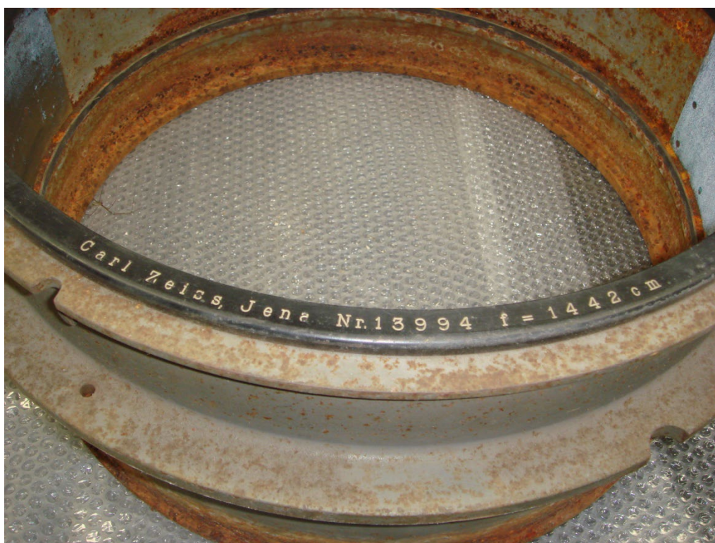
写真4 Carl Zeiss Jena Nr.13994 f=1442cm と書かれているセル 口径を測ったものが写真5である。