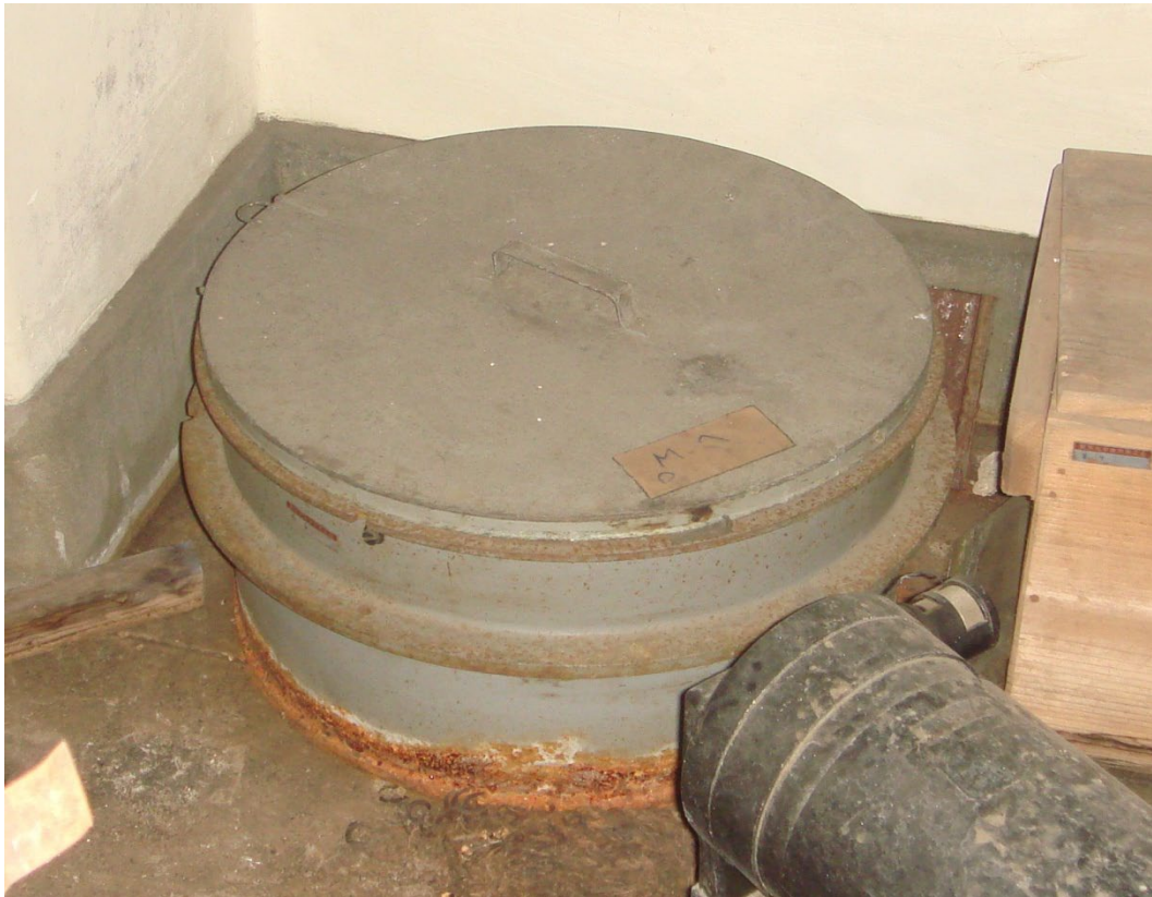
写真3 コンクリートの床に直置きされていたレンズセル

レンズが置かれた部屋の片隅のコンクリート床の上に直接レンズセルらしきものも確認されていた（写真3）。