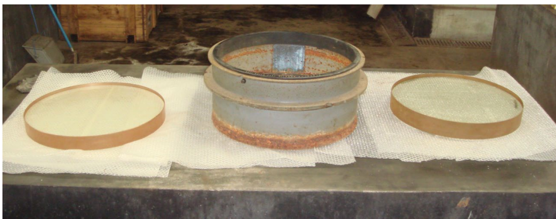
写真1 2枚玉のレンズとレンズセル

塔望遠鏡の光学系は何度か更新されているが、今回塔望遠鏡建設当時の望遠鏡レンズを発見した。このレンズがあったことは事実だし、紙に包まれ古い器械が入った木箱の上に無造作に置かれ、埃まみれになっていたことも知っていたのであるから、この発見という表現は不適当かもしれないが、何十年かぶり(おそらく50年以上)に人の目に晒されたレンズが写真1である。