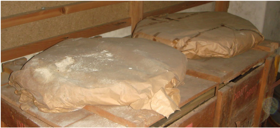
写真2 輸送箱の上に無造作に置かれ、埃にまみれたレンズ

掃除をした分光室の光学素子のピアの上で包んであった紙をめくってみると曇りもなく美しいレンズが現れた。