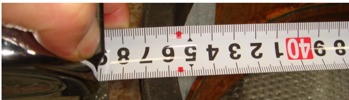
写真6 セルの内寸は45.8cm