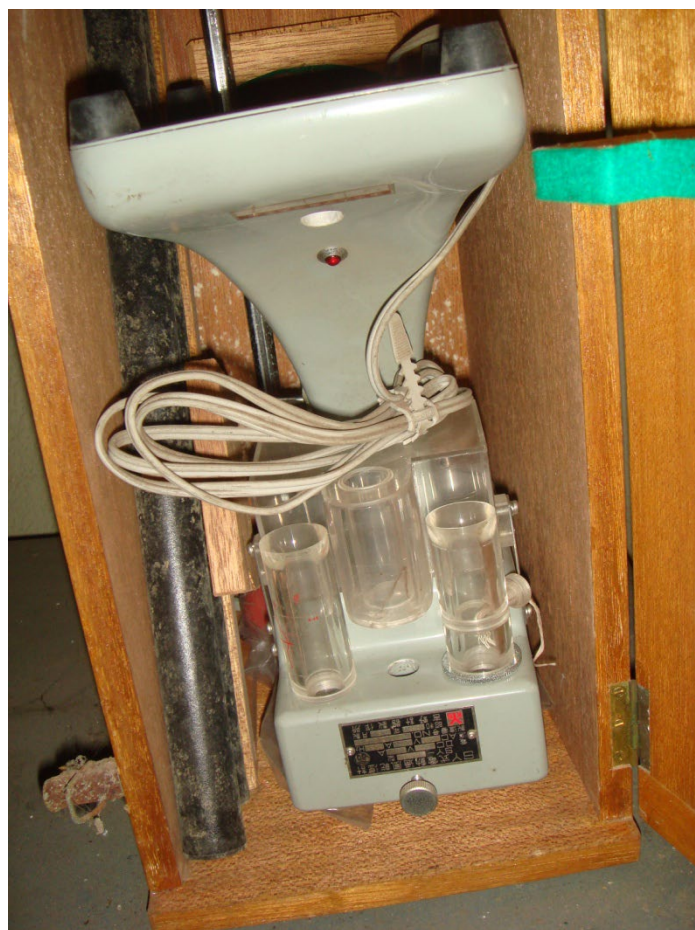
写真2 逆さまに入った状態だった

中のものを取り出してみると湿球の方に使うであろうガーゼはまだビニール袋に入ったままだったから、この湿度計は使われたことが無いようである。