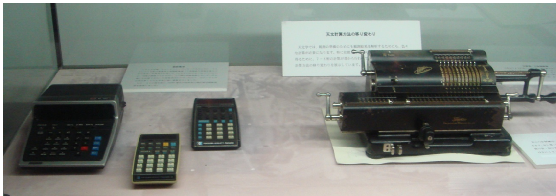
写真2 左が天文台で使われた電卓類、右が手回し機械式計算機（タイガー計算機）

台歴史館には天文台の歴史的な計算機として手回し器械式計算機（タイガー計算機）、電卓（写真2）のほかに対数表（写真3）も置かれている。