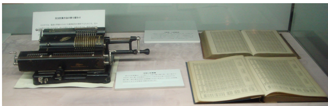
写真3 タイガー計算機の右におかれているのが対数表

計算尺は、天文計算室では使用されなかったかもしれないが、重要な計算の道具ではあった。そろばん、計算尺も天文台の計算の道具としてアーカイブに加えるつもりである。