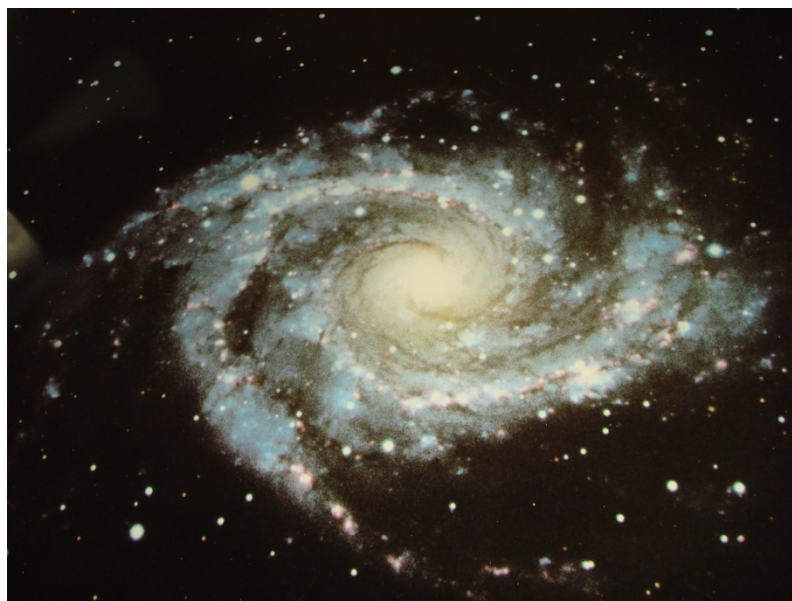
写真2 SPIRAL GALAXY IN ANTLIA (NGC 2997) (一部)