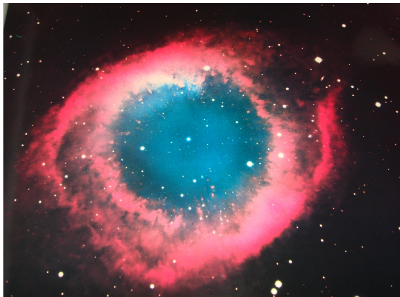
写真6 "HELIX" NEBULA IN AQUARIUS (NGC 7293) (一部)

の17枚である。この他に日本で撮影されたと思われる「北アメリカ星雲 S13 162」と乾板に書かれた文字が焼き付けられた写真1枚、アンドロメダ星雲 M31 69 11-12