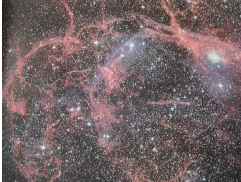
写真5 SUPERNOVA REMNANT IN VELA Shock Wave an Exploded Star (一部)

and both of are funded by the United Kingdom Science and Engineering Research Council Printed in USA 351-4