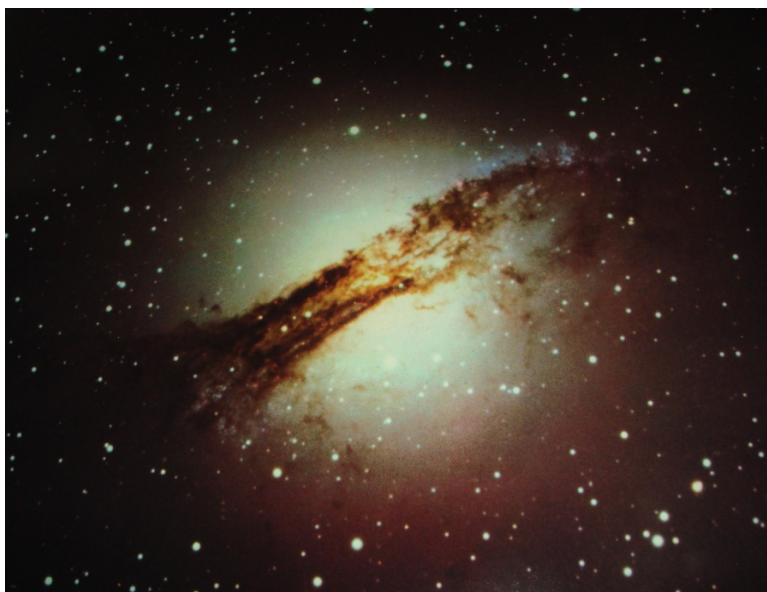
写真4 CENTAURUS A: PECULIAR GALAXY NGC 5128(一部)