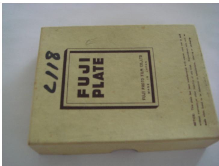
写真1 L118と書かれた乾板の入った箱

アーカイブ室新聞 458号の続編である。図書室から渡された段ボール箱に入っていた手札の写真乾板の箱10個を次々とデジタルデータとして読み込む作業をやっている。この号で5箱目である。今回は「L118」と書かれた箱(写真1)に9枚の乾板が入っていた。