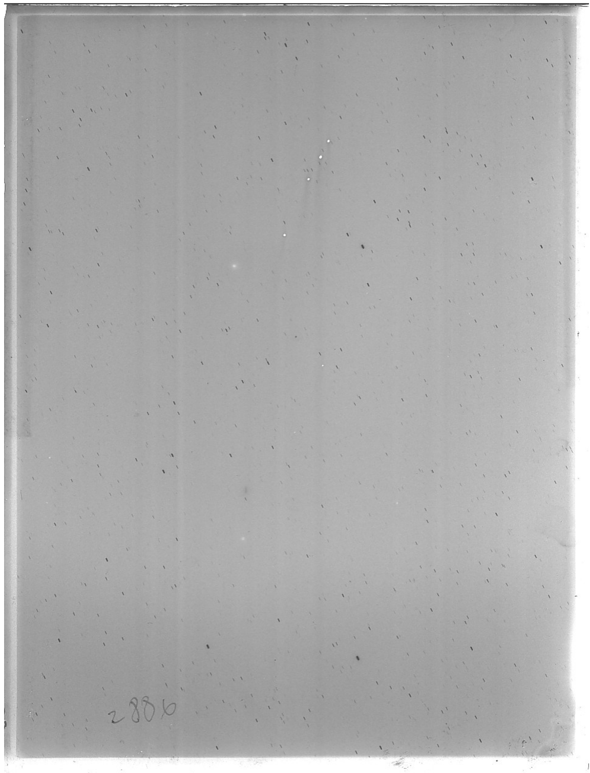
写真4 2886 と書かれた乾板