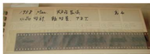
右上 写真2 右下 写真3