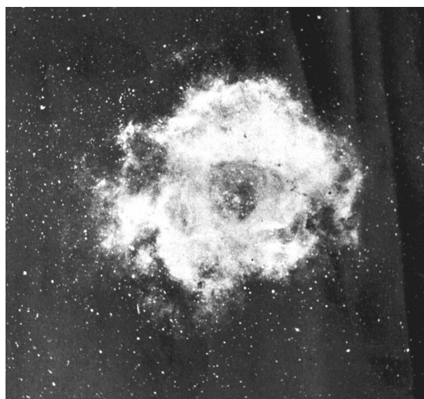
写真4 バラ星雲の複写