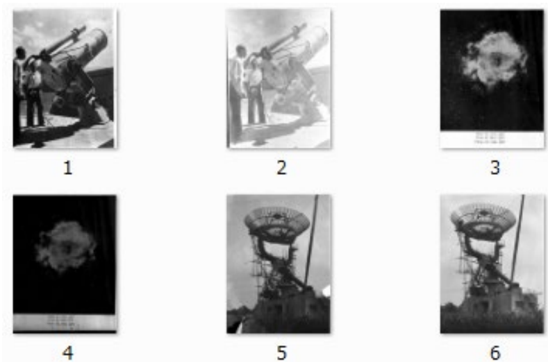
写真2-1 No.1~No.10のサムネイル

箱はFUJI PLATEのもので、表には、「日食 1953 VII-26」と書かれている。写真2が6枚の写真のサムネイルである。