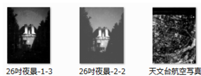
写真2 雑BOX-⑬-2に入っていた乾板のサムネイル