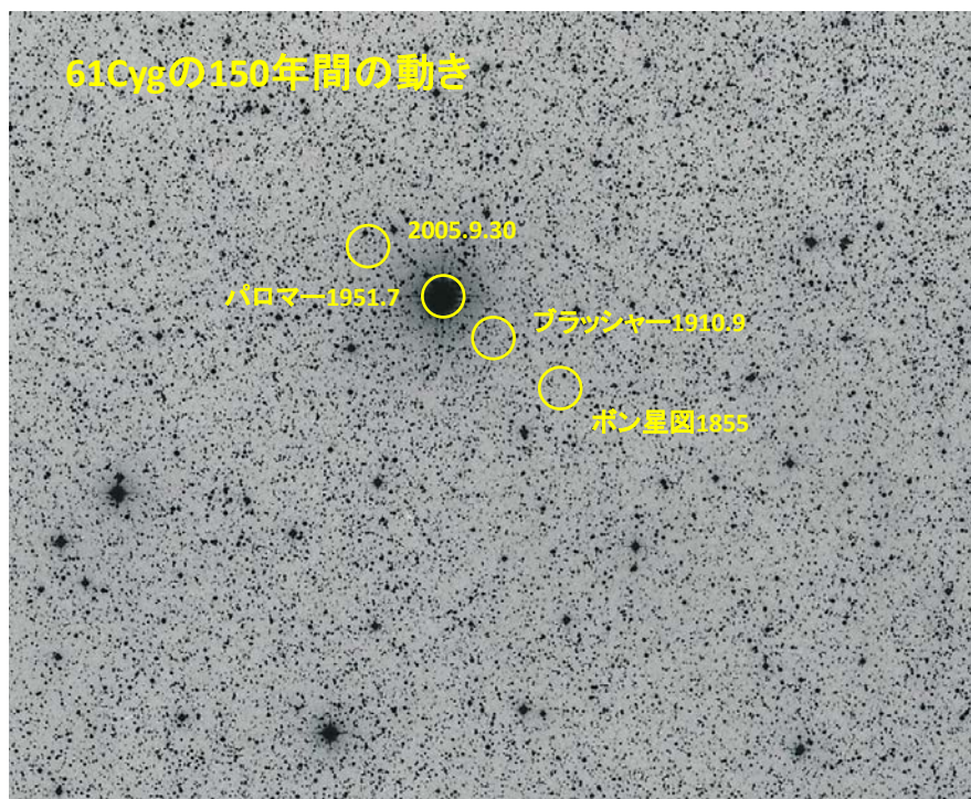
写真2 61Cygの150年間の動き

そこで、1855年のボンの星図、1951年7月のパロマー写真星図、そして変光星グループの応援で最近の61Cygの写った星野写真の情報を得て、2005年9月30日の位置を知ることが出来た。それらをパロマー写真星図の上にプロットした図が写真2である。