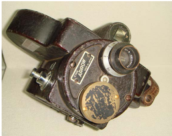
写真3 16mm 撮影カメラ