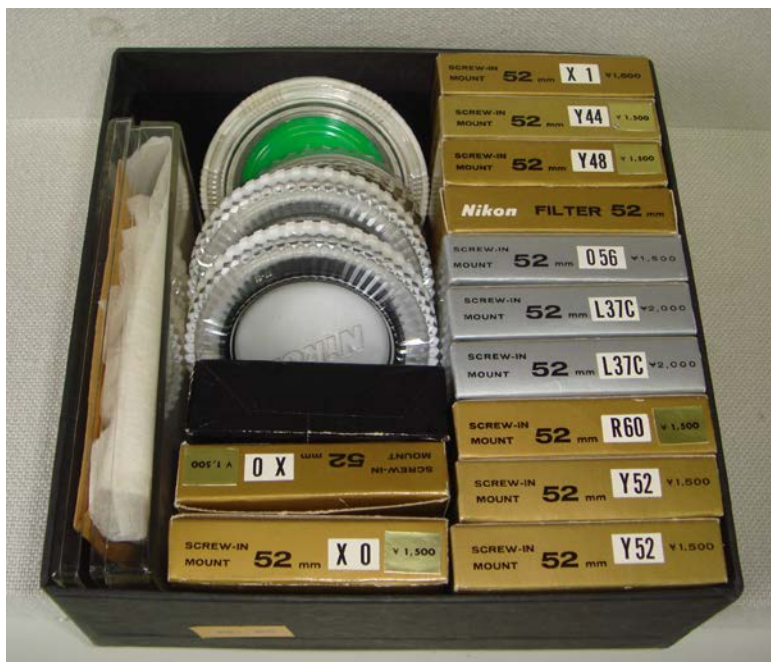
写真4 ニコンのフィルター類