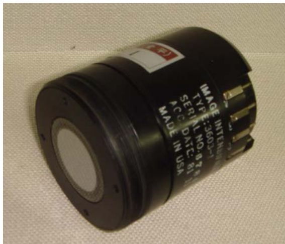
写真2 イメージインテンシファア