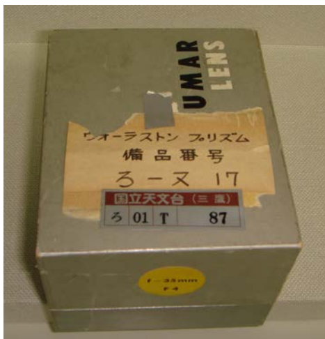
写真1 ウォーラストンプリズム