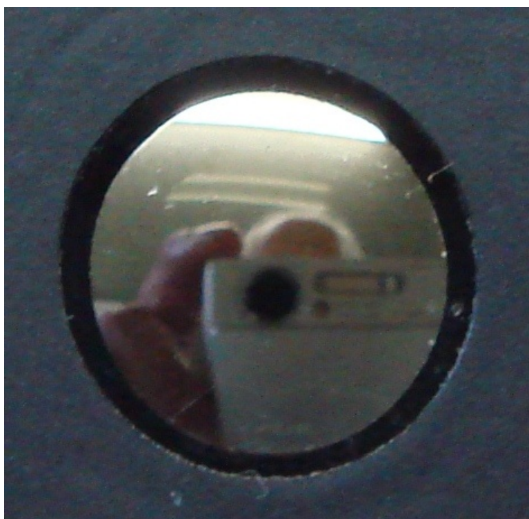
写真3 光電面が凸面になっている

光電面が凸面になっているのである(写真2)。写真2ではよくわからないので、光電面を拡大すると、そこに写った像は確かに凸面に写った像である(写真3)。