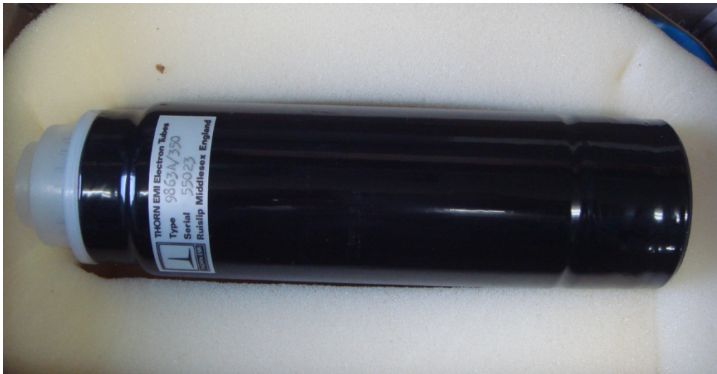
写真1 珍しいと言われた光電子増倍管

筆者には、この光電子増倍管のどこが珍しいかすぐには分からなかった。写真1が提供された光電子増倍管である。ごく普通の光電子増倍管に見えた。が、