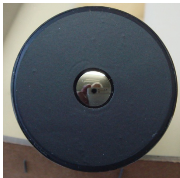
写真2 凸面になった光電面

合が多いがこのように、中心の小さな場所が光電面の場合もある。珍しい特徴が分かった。