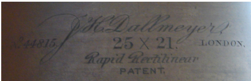
写真2が名盤の刻印