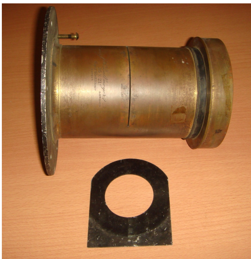
写真 3 絞りを抜いたところ

このレンズは発明当時、速写直正レンズ、速写直線レンズと呼ばれ、建物などが直線に撮影できる風景、人物用レンズとして重宝された。このレンズは、球面収差は修正されて