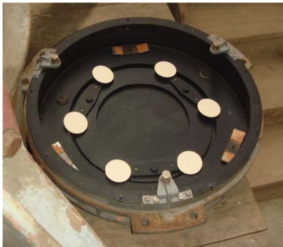
写真7 大鏡の3点支持

第2鏡は下を向いているので、ミラーセルの底は単純な3点支持（写真8）で、鏡面の外側でウィップルツリーの3点支持になっていた。