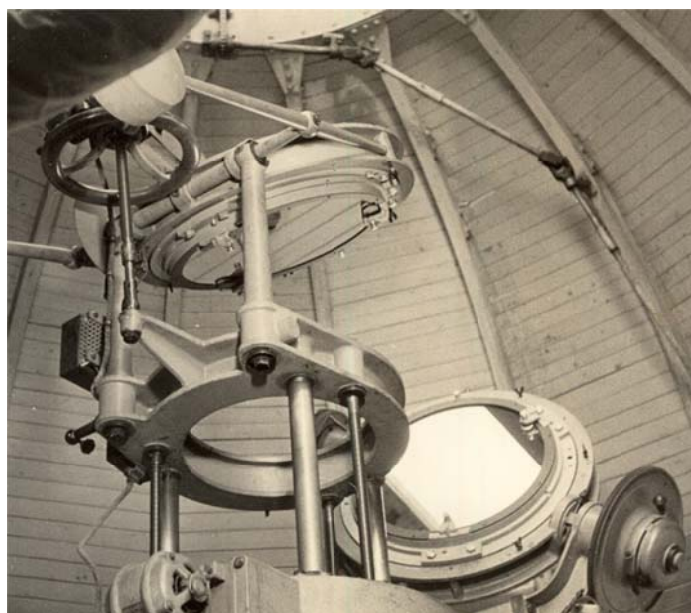
写真2 シーロスタット

塔と同じ光学系を同じ研究目的(アインシュタインの一般相対性理論で言われる大きな重力場から出る電磁波(光)は赤方偏移(波長が長くなる)の検証)で購入した。結局この赤方偏移の検証には失敗したが、日本の天文学における分光観測をけん引した重要な観測装置であった。 太陽塔望遠鏡は、逐次改良がくわえられ、昭和32年(1957年)にシーロスタット(写真2)の65cm鏡をガラス製から熔融水晶へと熱膨張係数の小さい鏡に取り換えられ、1967年(昭和42年)ころまで太陽の分光観測に 写真1 太陽塔望遠鏡棟 使われた。1968年1月に、この太陽塔望遠鏡の後継機として岡山天体物理観測所に建設された65cmクーデ型太陽望遠鏡にその役目を譲り長い眠りについていたのである。2008年(平成20年)に発足したアーカイブ室の活動で、順次この太陽塔望遠鏡の整備を進めているが、今回はその整備の一環としてこのシーロスタットの平面鏡の反射面を56年