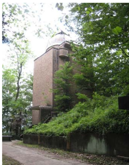
写真1 太陽塔望遠鏡棟

我々は、国立天文台の登録有形文化財の整備の一環として太陽塔望遠鏡の整備を行っている。太陽塔望遠鏡(写真1)は、ドイツ・ベルリン郊外のポツダムにあるアインシュタイン