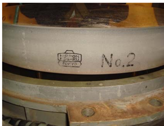
写真10 第1鏡セルに入っていた鏡

ドームの中は狭く、門型クレーンでの作業は非常に窮屈であり、再蒸着前の鏡だから平気で毛布を掛けて作業したが、再蒸着された鏡の組み立て作業の養生が思いやられる。