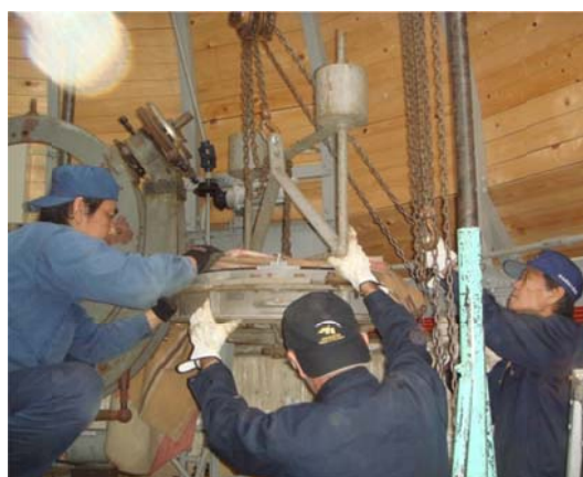
写真6 床に下すところ

ミラーセルから平面鏡を取り出すための押しねじも用意されており、3本の押しねじで下から押し出し平面鏡を取り出した（写真7）。シーロスタットの第1鏡は極軸の上に乗っており、鏡は重力方向で支えるため、ウィッフルツリーの3点支持（写真7）になっており、