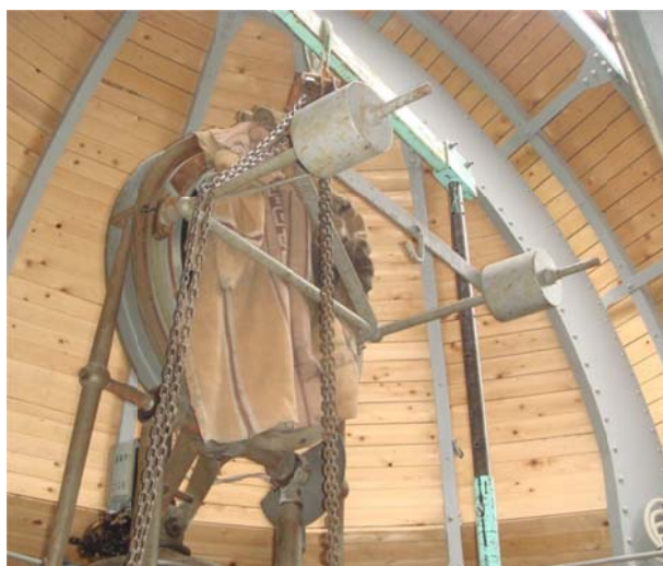
写真4 ミラーセルに吊り具をセット

シーロスタットから平面鏡を取り外すため、ドーム内に門型クレーン（写真5）を設置して写真4のように吊り具のカウンターウエイトと鏡の重心を吊ってミラーセルが入っている枠の金具から横に引き出すようにして外し、床におろした（写真6）。