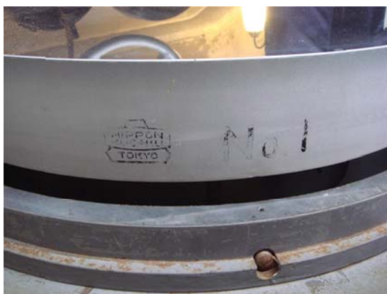
写真9 第2鏡セルに入っていた鏡

写真9、10がミラーセルから平面鏡を浮かせたところであるが、なぜか第1鏡セルにNo. 2、第2鏡セルにNo. 1の平面鏡が入っていた。どちらも同じ口径の平面鏡ではあるが、普通はそういう組み立てはしないものである。