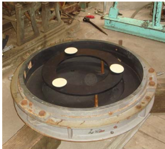
写真8 第2鏡の3点支持

写真9、10がミラーセルから平面鏡を浮かせたところであるが、なぜか第1鏡セルにNo. 2、第2鏡セルにNo. 1の平面鏡が入っていた。どちらも同じ口径の平面鏡ではあるが、普通はそういう組み立てはしないものである。