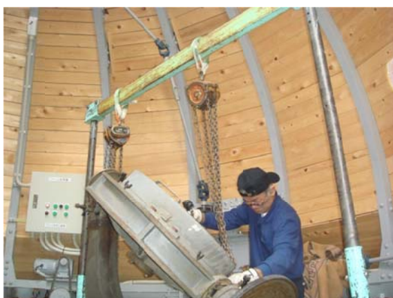
写真5 門型クレーン

シーロスタットから平面鏡を取り外すため、ドーム内に門型クレーン（写真5）を設置して写真4のように吊り具のカウンターウエイトと鏡の重心を吊ってミラーセルが入っている枠の金具から横に引き出すようにして外し、床におろした（写真6）。