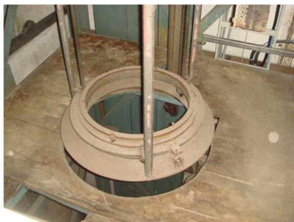
写真4 対物レンズユニットが入る枠体

太陽塔望遠鏡は、逐次改良がくわえられ、昭和32年(1957年)にシーロスタットの65cm