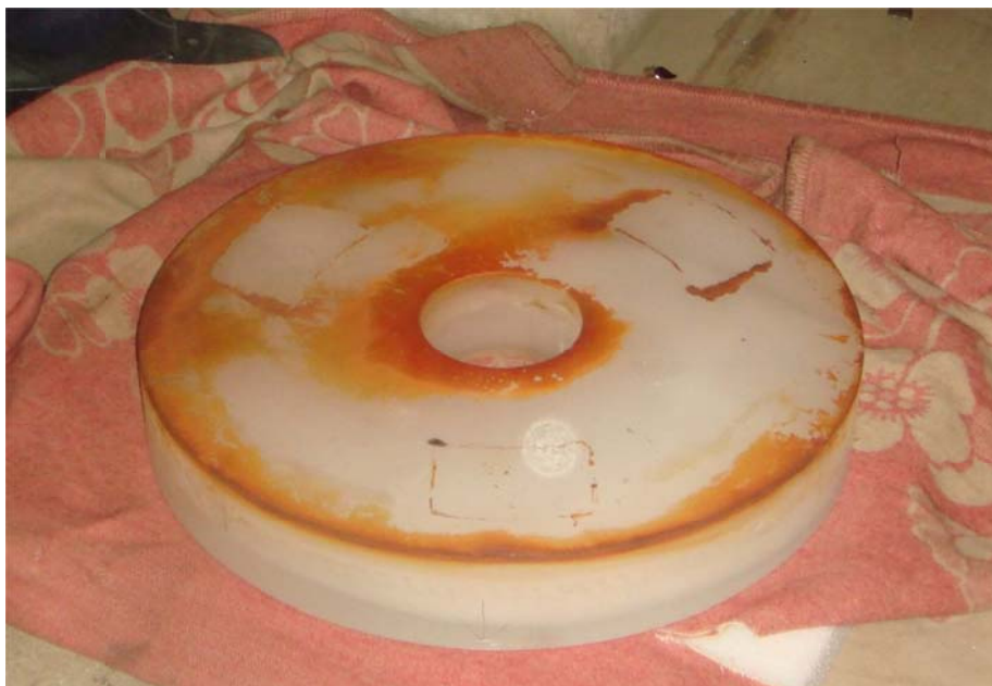
写真10 水没していた主鏡の裏面の様子

鏡が再蒸着され、戻ってくるまでにはこれらのミラーセルをきれいにしておかなければ ならない。水没していた主鏡の裏面の状態が写真10である。