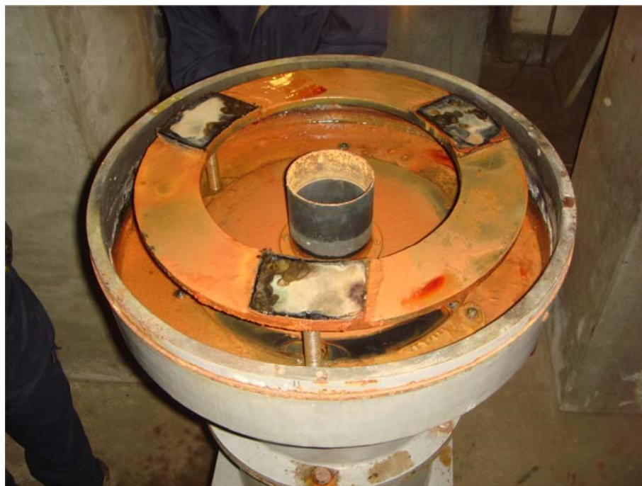
写真8 結露した水で内部が錆びた主鏡セル

この主鏡を取り外す作業の際、驚くべき事態が起きた。主鏡の傾きを調整する主鏡セル下部のねじを抜いたところ大量の水が噴き出したのである。主鏡セルの中に長年にわたって結露した水が溜まり、主鏡は高さ方向の1/3は水に浸かった状態であったようだ。写真9が主鏡を取り出した主鏡セルである。