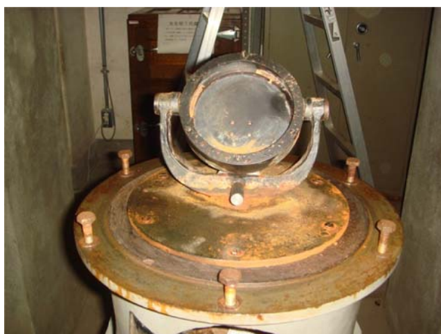
写真9 第3鏡部 鏡は取りだされている