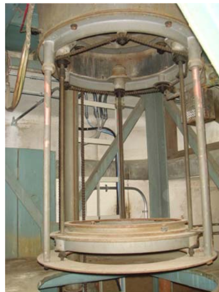
写真2 屈折望遠鏡対物レンズ部