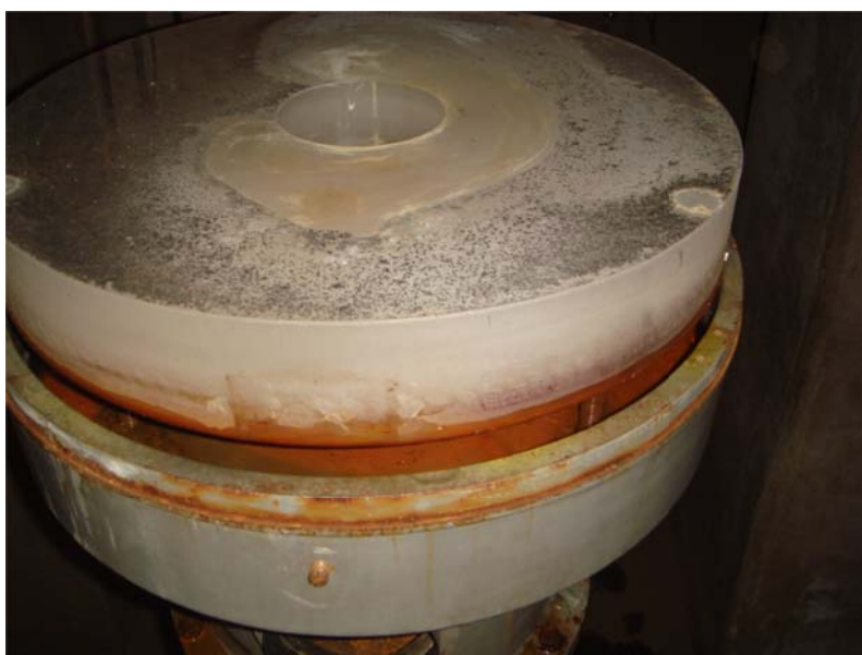
写真7 非常にひどい状態の主鏡

今回、登録有形文化財整備の一環として、太陽塔望遠鏡のシーロスタットの平面鏡と合わせてこの反射望遠鏡主鏡の反射面の更新のために主鏡を取り出す作業を行った。この主鏡の反射面の痛みは非常にひどい状態であった（写真7）。