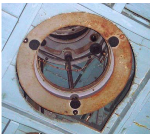
写真3 シーロスタットを見上げたところ