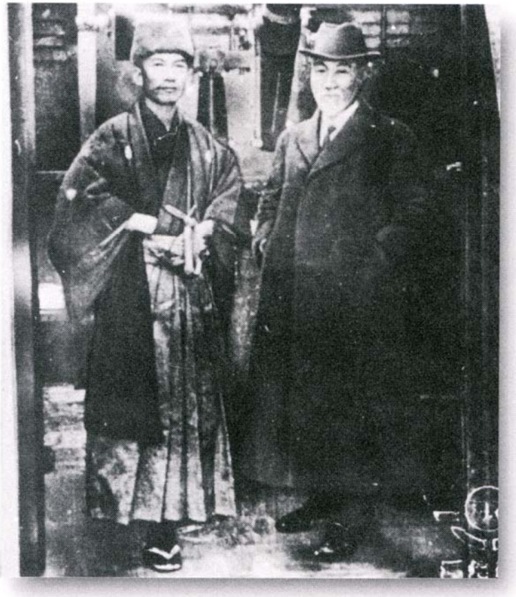
写真3 緯度観測所100年の木村榮と田中館愛橘

「日本の天文学の百年」が刊行された2008年は筆者が国立天文台でアーカイブの仕事を始めたばかりの頃であった。そしてアーカイブ室新聞22号(2008年6月13日)には日本天文学会初代会長寺尾寿の東京大学教授満25年祝賀会の記念写真を発見していた。またアーカイブ室新聞19号(2008年6月11日)には「井上四郎資料2(第1回文化勲章受賞 木村榮の正装写真発見)として木村榮が天頂儀の前で観測野帳を持った紋付きはかま姿の写真(写真4)を発見していたのであった。筆者が発見したこの2枚の天文学黎明期の重大な