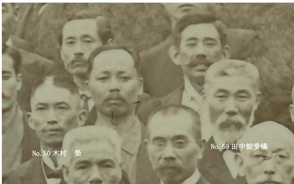
写真6 木村榮と田中館愛橘

42年(1909年)である。木村榮 39歳、田中館愛橘 53歳である。写真6が写真2の木村榮とその近くに田中館愛橘が写っている場面である。