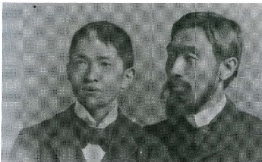
図1.5.2 木村(左, 29歳)と田中館(43歳). シュトゥットガルトのIAG総会(1898年).

日本天文学会は1908年に設立され、2008年に創立100周年を迎え、記念誌として表記「日本の天文学の百年」という冊子が発行された。この冊子の第5章「緯度観測所90年の歴史」の中に掲載された初代所長木村榮と田中館愛橋の2人が写った1898年のシュトゥットガルトのIAG総会のツーショットの写真(写真1)に間違いがあるという指摘があった。