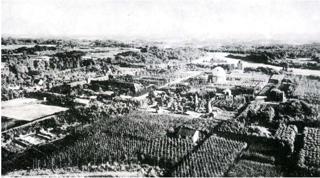
写真7 60m 鉄塔から撮影したものと思われる本館が写った写真

これらアーカイブ新聞の記事にお気づきのことがあれば、編集者中桐にご連絡いただければ幸いです。中桐のメールアドレスは、 arcnaoj@pub.mtk.nao.ac.jp