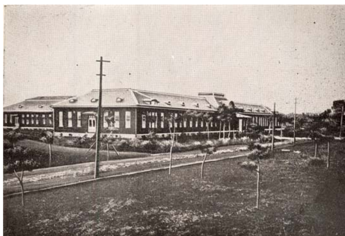
写真2 萬有科学体系普及版に掲載されている東京天文台本館

旧東京天文台本館は1945年(昭和20年)2月8日未明の火災で焼失しており、その全景写真は東京天文台に残っておらず、昭和6年9月1日発行の新光社版の「萬有科学体系普及版」に東京天文台本館の写真が掲載されていたことが分かっている(写真2)。