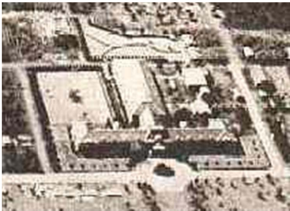
写真5 東京天文台の百年に掲載された写真

天文台に残っていなかった貴重な写真が集まり、收藏されていくことは、アーカイブ室を立ち上げた筆者としてこの上ない喜びである。