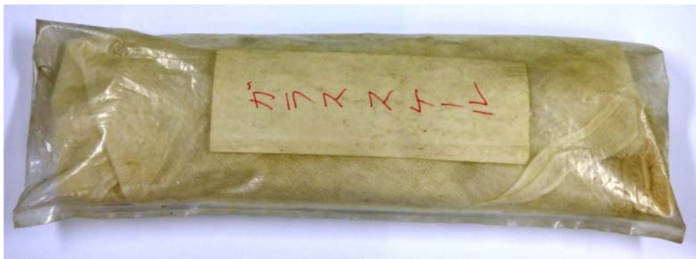
写真1 ガーゼに包まれビニール袋に入ったガラススケール

以前にも、先人の退職した後のデスクの引き出しに遺されたものが菓子折りの箱に入れて残されており始末に困るということを書いた。7本のガラススケールがガーゼに包まれビニール袋に入った状態で発見された(写真1)。おそらくこのガラススケール(写真2)もその類いであろう。使われていた本人にとってはその時点で大切なものであったに違いない。ガラスは金属に比べれば熱膨張係数が小さく正確な測定ができたのである。現在ではガラススケールというものを使う場面はないのかもしれない。せいぜい1/10mm程度の精度でしか読めない代物である。