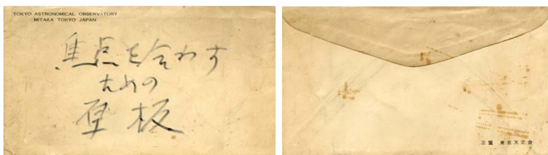
写真1 「焦点を合わせるための厚板」が入っていた封筒の表裏 入っていた「焦点を合わせるための厚板」が写真2である。

今回の収蔵品は、「焦点を合わせるための厚板」と書かれた写真乾板である。おそらくオリジナルの焦点板があり、それを写真乾板に密着焼き付けをしたものと思われる。この焦点板は写真1の東京天文台の洋封筒に裸で入れられていた。封筒の表左上には、TOKYO ASTRONOMICAL OBSERVATORY MITAKA TOKYO JAPAN とあり、裏には右下に 三鷹 東京天文台 と印刷されている。