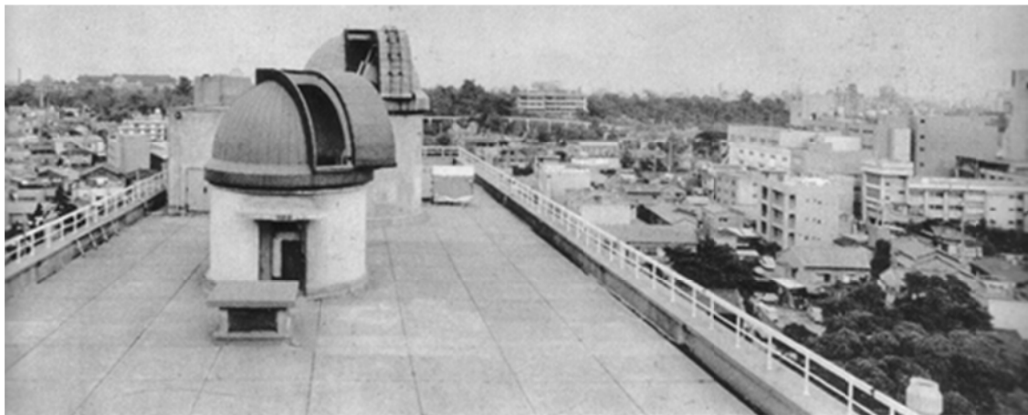
写真2 東大理学部3号館屋上 手前が40 cm望遠鏡ドーム、奥が60 cm望遠鏡ドーム

る。写真2は東京大学理学部3号館屋上の写真である。手前が40 cm反射望遠鏡ドーム、奥が60 cm反射望遠鏡ドームである。この60 cm反射望遠鏡を主に使った山下泰正先生が、筆者が変光星の観測をしていた頃の指導者であった。