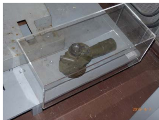
写真3 ケースに入ったエルボー

このエルボーは発見した際写真も撮り、かなり前から天文機器資料館に収蔵していたのでいまさら発見というのも不適當だが、再発見には違いない。銘盤を見るとシリアル No. 以外は全く同じである。写真4がアーカイブ新聞789号のものでシリアル No. 12739、写真