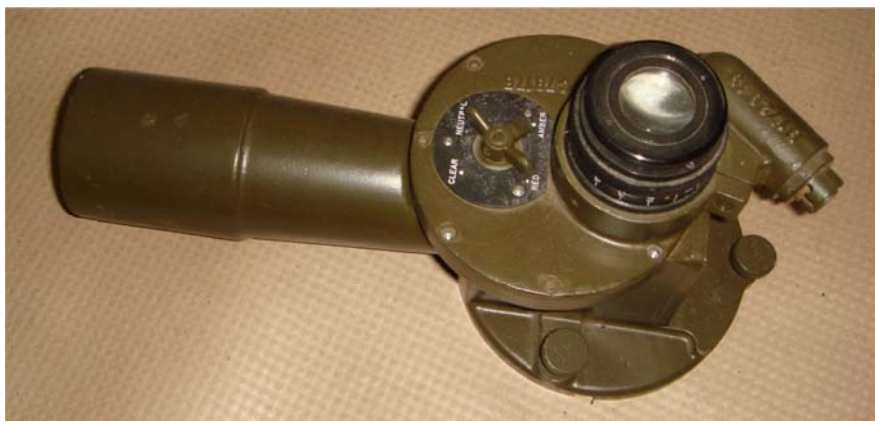
写真1 エルボーの写真

アーカイブ新聞第789号に「1942年製エルボー望遠鏡発見」という記事を書いた。しかし、かすかな記憶にこの望遠鏡と同じ完全な姿の望遠鏡を見た記憶があった。パソコンのメモリーを検索するとエルボーという項があり、これと別の完全な姿のエルボーの写真があった(写真1)。