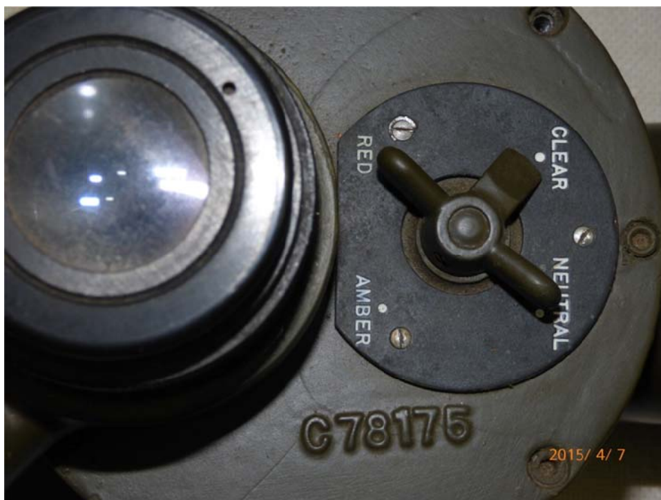
写真8 ターレットの4つの表示

ターレットの4つは、1) CLEAR、2) NEWTRAL、3) AMBER、4) RED となっている (写真8)。