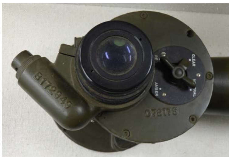
写真 7 エルボーの接眼部