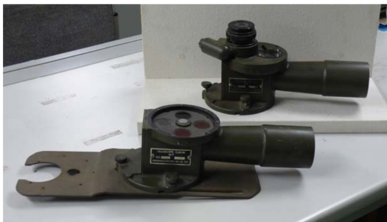
写真 6 2つのエルボー

アーカイブ新聞 789 号のエルボーと今回のエルボーを並べたのが写真 6 である。