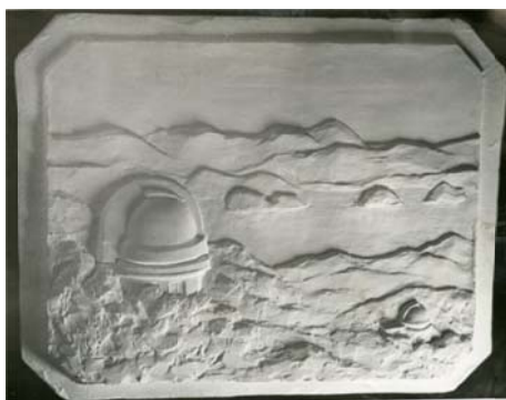
写真 22 岡山天体物理観測所開所記念品