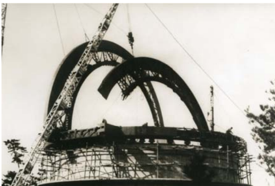
写真 3 メインアーチ取付

写真 3、4 の 2 枚は、ドームのメインアーチ取付工事、写真 5、6 はメインアーチからドーム壁面へと進む様子が写っている。