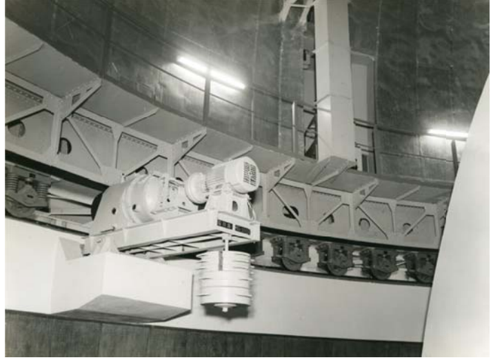
写真 13 ドーム回転機構

写真 14、15、16、17 は完成したドーム写真 7 枚のうちの 4 枚である。