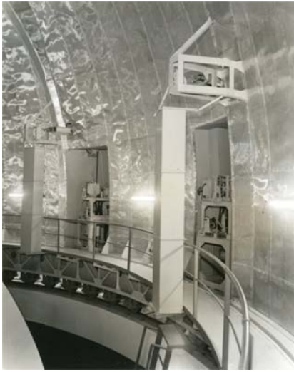
写真 12 スリット駆動部