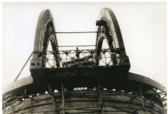
写真 4 メインアーチ工事