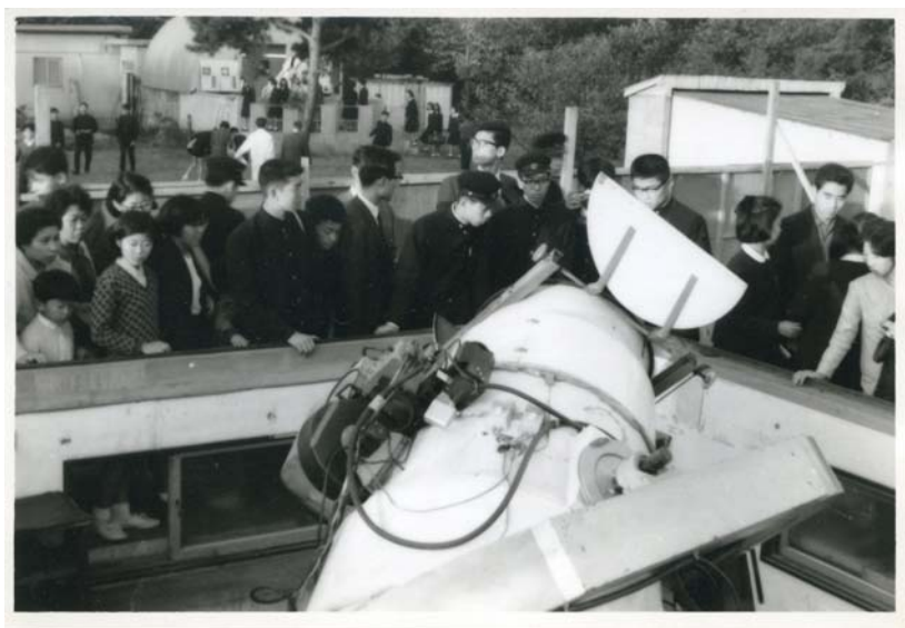
写真11 ベーカーナン・シュミット望遠鏡見学風景

当時は、東京天文台の一般公開には三鷹駅から臨時バスが運行されており、構内に入っていた。またベーカーナン・シュミット望遠鏡は三鷹にあり、その後堂平観測所に移設された。ベーカーナン・シュミット望遠鏡の後方には太陽単色写真儀（モノクロ）のドームが写っている。このあたりは現在は東京大学大学院理学研究科天文学教育研究センターの敷地になっている。また、記念植樹の後ろには車庫が写っているが、この植樹で植えられた木は同定できないでいる。