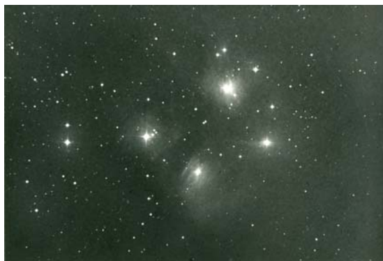
写真 7 プレアデス星団

写真 7 はプレアデス星団、写真 8 はハレー彗星、しかしどちらもデータはない。