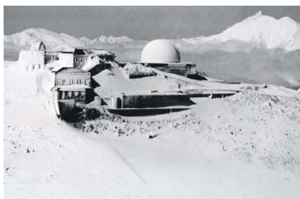
写真 2 (P38)