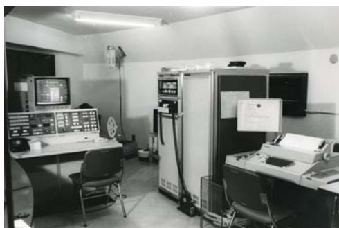
写真 3 木曾観測所シュミット望遠鏡制御計算機