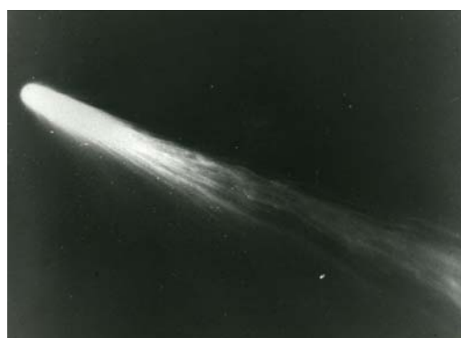
写真 8 ハレー彗星