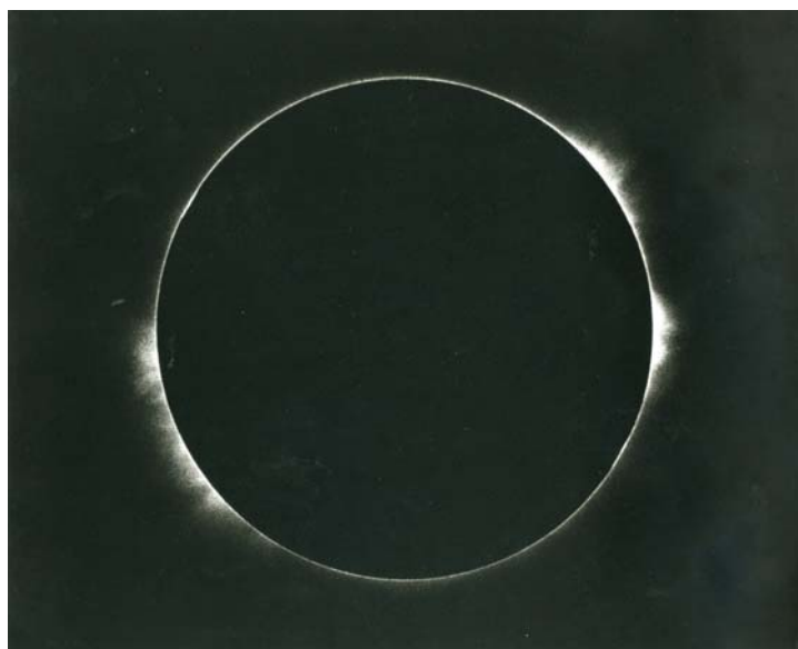
写真9 1968年11月1日 コロナグラフで撮影したコロナ

ハレー彗星は、1986年の前、1910年（明治43年）に現れ、東京天文台で撮影されていたから、その時の写真であろう。写真9は、乗鞍コロナ観測所のコロナグラフで撮影されたコロナの写真