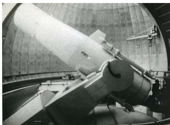
上 写真 2 下 写真 3