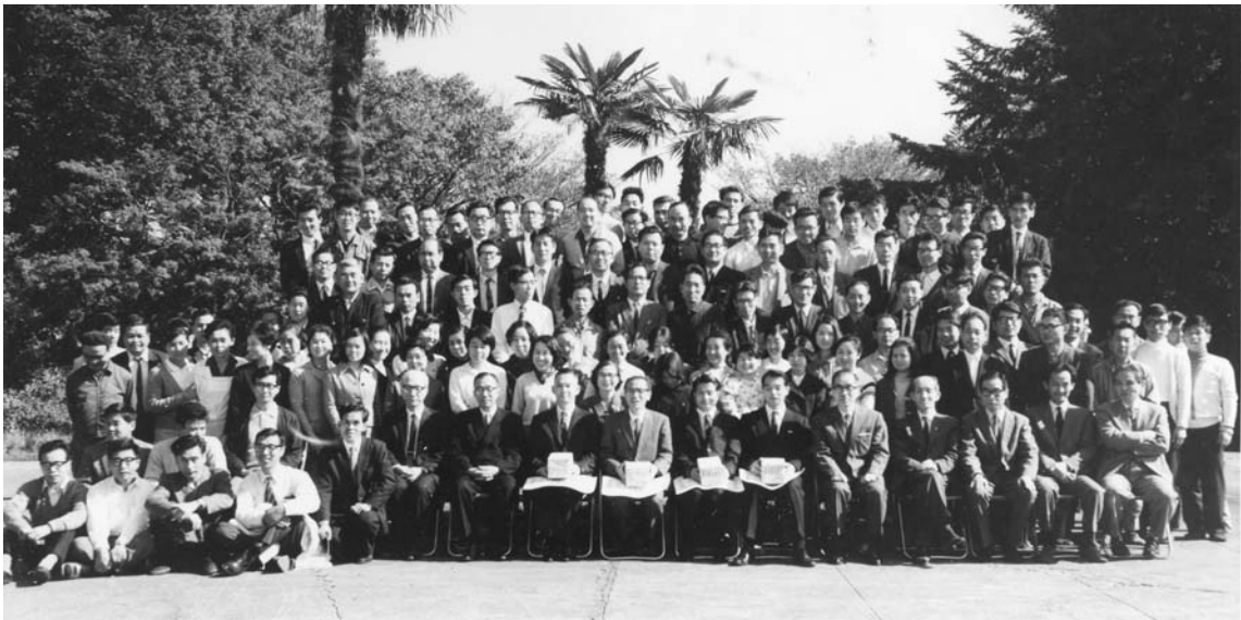
写真1 1969年10月29日 永年勤続表彰記念写真

東京天文台は75周年記念式典を10月29日に行い、それ以来、10月29日を東京天文台記念日とし、永年勤続者（25年）表彰や運動会などの行事を行っていた。