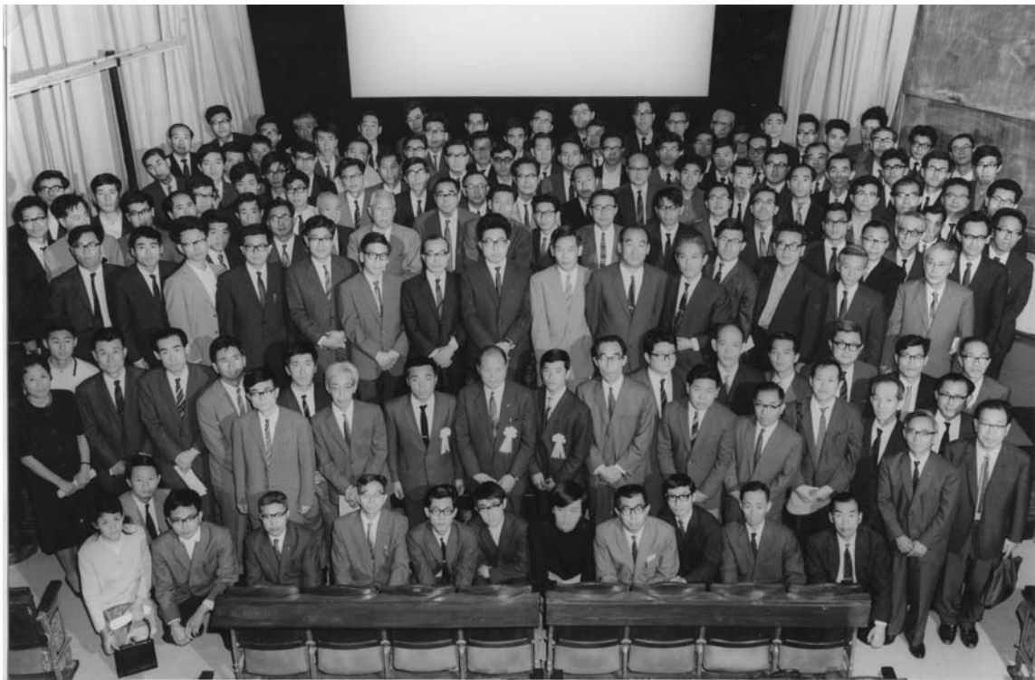
日本天文学会 1969年 春季年会