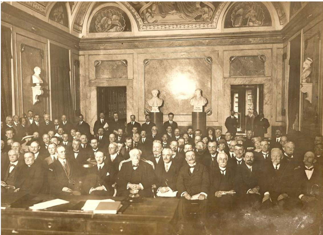
写真1 ローマに於ける国際天文連合第一回総会 記念写真

1922年(大正11年)の International Astronomical Union に東京天文台第2代台長であった平山信が出席している。この国際会議は、ローマで開かれた国際天文連合第一回総会であった。この時の記念写真(写真1)を平山信のお孫さんである国立天文台名誉教授平山淳氏から収蔵させていただいた。この写真は「東京大学東京天文台の百年 1878-1978」11ページに掲載された写真である。