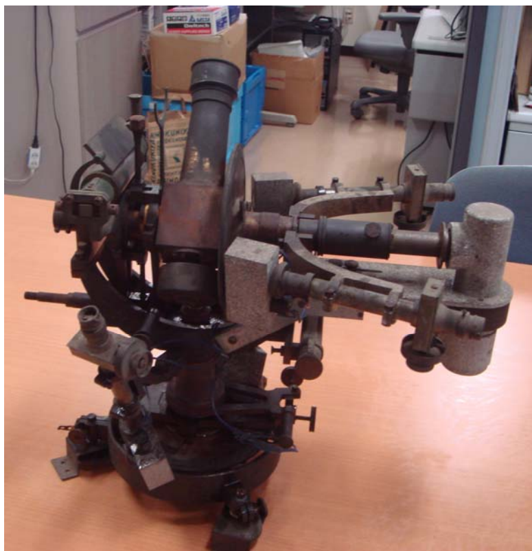
写真3 一応、組み上がった30mmバンベルヒ経緯儀

写真2 古い木箱の上に無造作に置かれ、埃にまみれた状態で置かれていたとにかく、何か分からないが面白いものを発見したと思い、部屋に持ち帰り、大まかにほこりを払い組み上げてみた。組みあがったには組みあがった(写真3)が、駆動部と思われる回転軸はびくとも動かなかった。