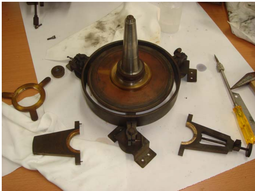
写真4 方位軸の軸受けを分解したところ

組み上げたが、次には完全にバラす作業を始めた。筆者は国立天文台で観測器械の開発を40年もやってきた者である。天文の精密機械の扱いは慣れている。まずは方位軸を分解した（写真4）。分解された軸受けを見ていただこう。