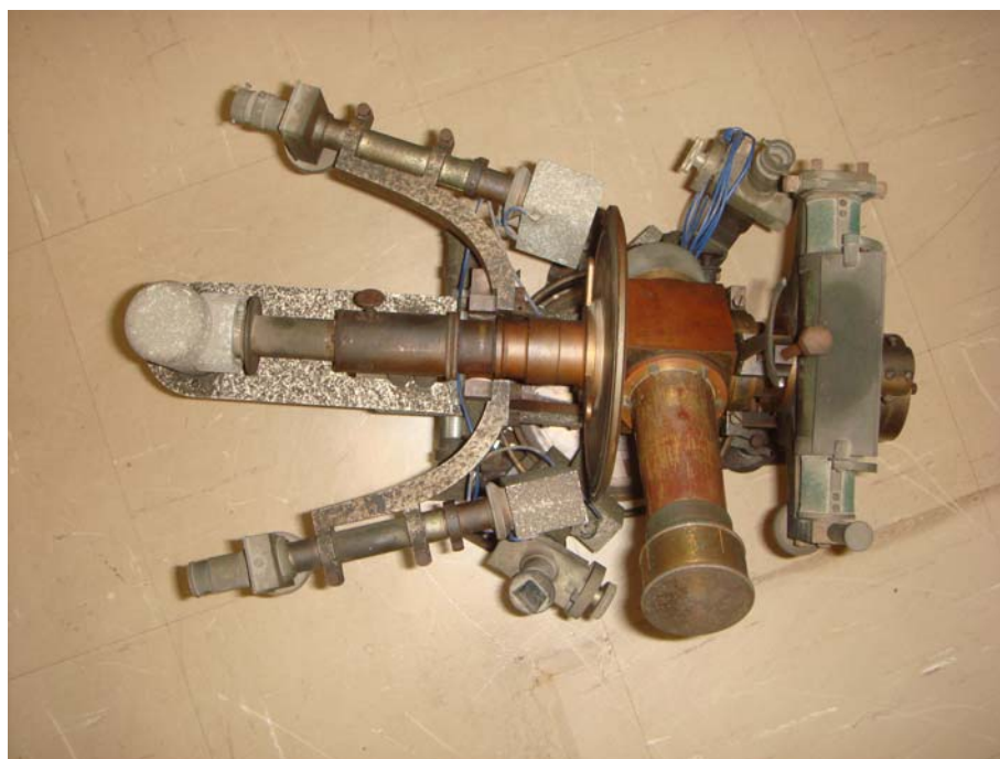
写真8 アルミで追加改造された部分分かる写真

この 30mm バンベルヒ経緯儀の大きな特徴は、原形をほぼ留めながら、光電子増倍管を使った新しい観測方法の開発に使われた事である。接眼部を改造し光電子増倍管が取り付けられるように改造された部分はアルミで製作されており、天文台の実験工場で作られたものと思われる。写真8に見られるようにドイツ・バンベルヒで製作された真鍮の重厚な部分に対し、後で追加されたアルミの腕は錆が進行している。