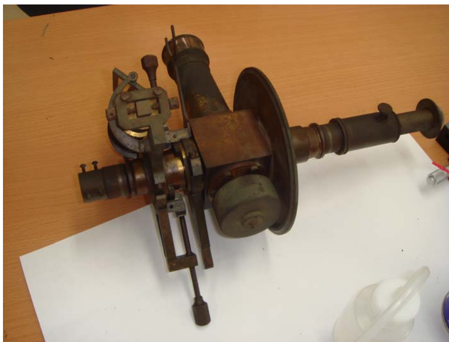
写真5 高度軸から外された望遠鏡部