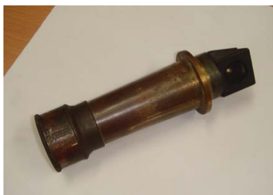
写真6 望遠鏡を外したセンターキューブ