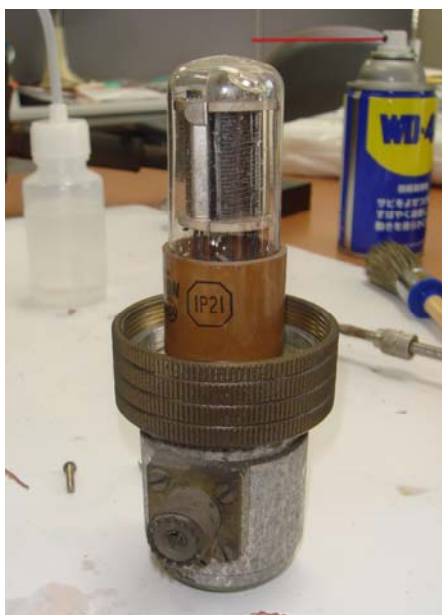
写真9 懐かしい光電子増倍管 1P21

このように、完全に分解し、清掃し、注油して再び組上げたところ、方位軸、高度軸共に滑らかに駆動できるようになった。完全に復元した姿が写真10である。