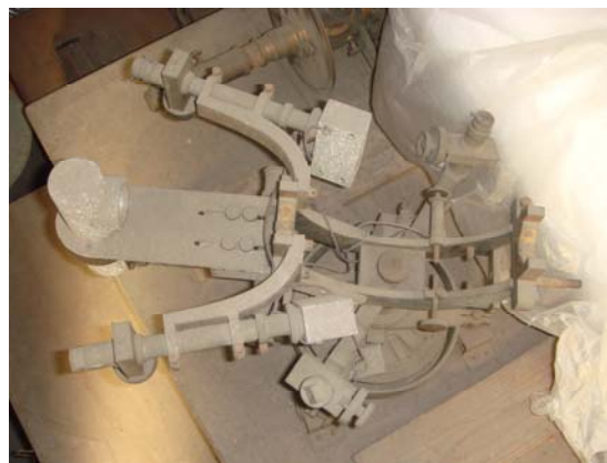
写真2 古い木箱の上に無造作に置かれ、埃にまみれた状態で置かれていたとにかく、何か分からないが面白いものを発見したと思い、部屋に持ち帰り、大まかにほこりを払い組み上げてみた。組みあがったには組みあがった(写真3)が、駆動部と思われる回転軸はびくとも動かなかった。