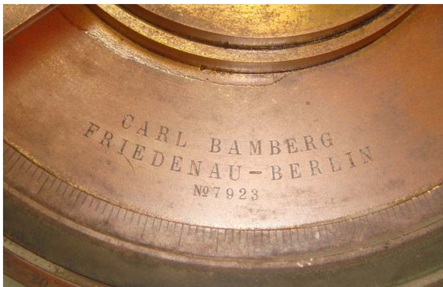
写真1 CARL BAMBERG FRIDENAU-BERLIN No. 7923 の刻印

筆者が Solar-B の開発を終え、この衛星打ち上げ成功後、天文情報センターに移って、2007年12月には子午儀資料館を立ち上げ、新しい2008年を迎え、天文情報センターの倉庫を漁っていたおり、偶々発見したものである。発見当時は積み上げられた古い木箱の上に裸で埃まみれでバラバラの状態であり、何かも分からないまま、部屋に持ち帰り、ほこりを払い、何とか組み上げてみると経緯儀望遠鏡のようであった。しかし、口径は僅か30mmである。それほどものではなかろうとと思っていたが、よく掃除をしてみると方位軸の目盛盤に驚く刻印(写真1)を見つけ驚愕したのである。