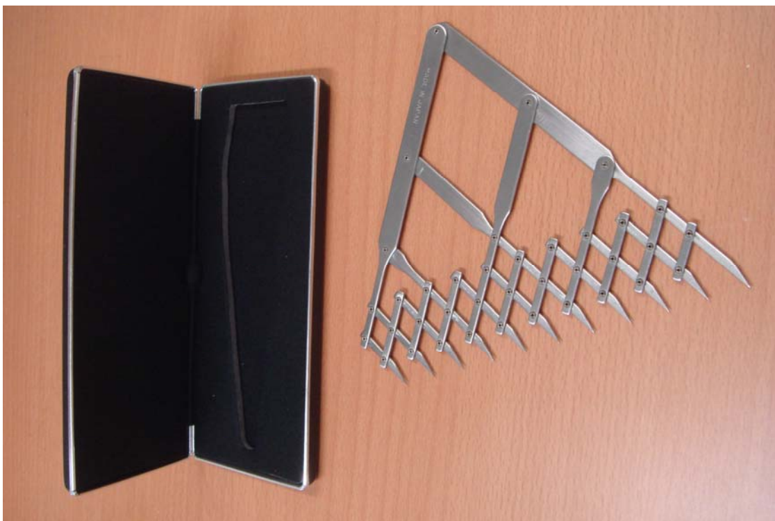
写真1 デイバイダー

アーカイブ室新聞第208号で曲線自在定規収蔵を紹介した。これはパソコン発達前の文房具であった。今回は同時期の文房具のひとつ「デイバイダー」を収蔵したので紹介する。デイバイダーは一定の長さ、幅などを任意に分割、比例拡大、縮小が簡単に出来る文房具(製図器の一種)(写真1)である。写真1は斜めに撮影してあるから針の先が比例等分で無いように写っているが、等間隔でなければならない。