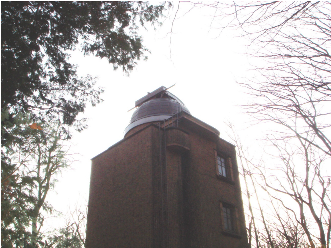
写真8 ドームスリットが西を向いた塔望遠鏡棟

今までのワイヤーによるドーム回転機構は考え直した方がいいように思える。仕事が次々と湧いてくる。