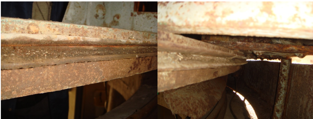
写真6 ワイヤーが走る溝