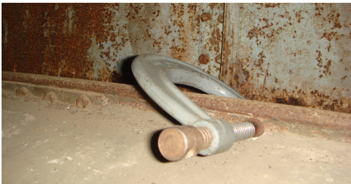
写真 3 レールに取り付けたシャコマン

しかし、ハンドルでワイヤーがかかったプーリーを廻しても大変な力が必要だし、ワイヤーが滑ってドームが回らないので、いろいろ検討した結果、レールにシャコマン(写真 3)でドームを引っ張る支点をつくり、ドーム構造の鉄骨との間をパワーウインチで引っ張りドームを廻すことにした(写真 4)。