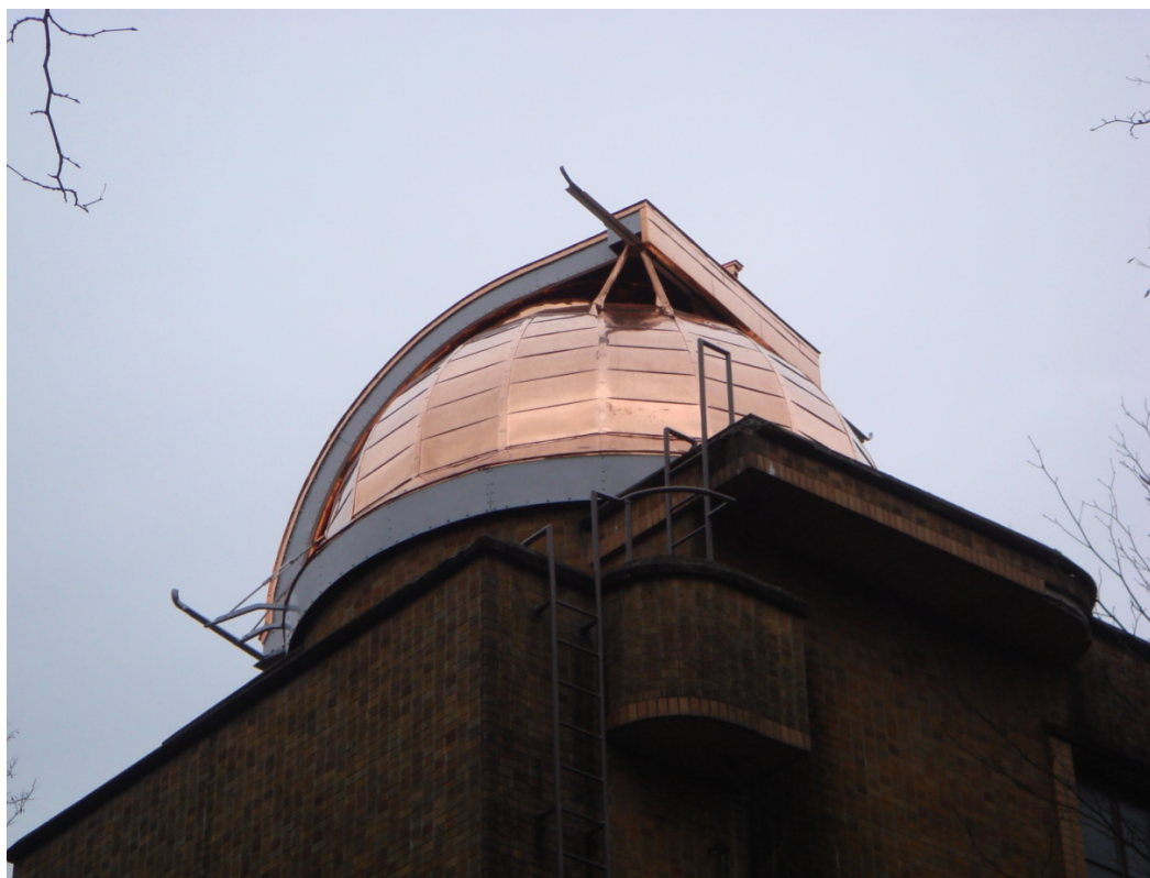
写真1 雨漏り修理が終わり金色に輝くドーム

アーカイブ室新聞第279号に「塔望遠鏡ドームの雨漏り終了、ただ今の住民は「たぬき」(2010年2月1日)」という記事を書いた。その時点で塔望遠鏡のドームは金色に輝くドームに変身した(写真1)。そしてアーカイブ室新聞第317号に「電気が回復し、LANも引かれた塔望遠鏡室(2010年4月15日)」という記事を書いた。そして6月には塔望遠鏡の建物の整備が一段落した段階で国立天文台内で40数年ぶりに人を入れるお披露目の会をやった。そして何と10月の国立天文台の特別公開ではついに史上初めて見学者を入れるまで整備された。そうするとだんだん欲が出てくる。