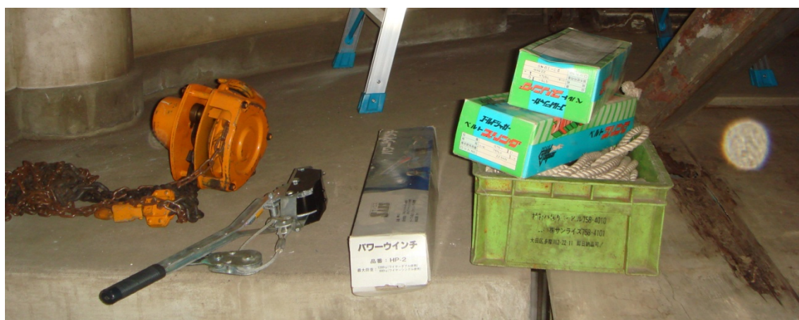
写真 2 集めた道具類

さあ、次は筆者達の出番であった。3 相電力が来ていないドームを廻すには人力に頼るしかない。45 年使われなかったモーターでも電力を供給できれば回せると思うが動力の電力が来ていない。しかし、レールを走る車輪に乗ったドームだから何とかなると道具、助っ人を集め作業することにした。準備した道具は、1) 2 トンチェインブロック、2) スリング 2 本、3) パワーウインチ 2 個、4) シャコマン 2 個、5) シャックル 2 個、6) シャコマンを締める鉄棒代わりの 6 角レンチ、7) 何かのためのロープ、8) 脚立 2 個である。写真 2 は集めた道具類。助っ人は 2 人。