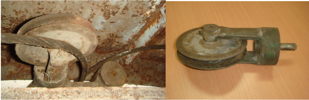
写真5 1対のプーリーの1個が抜け落ちた