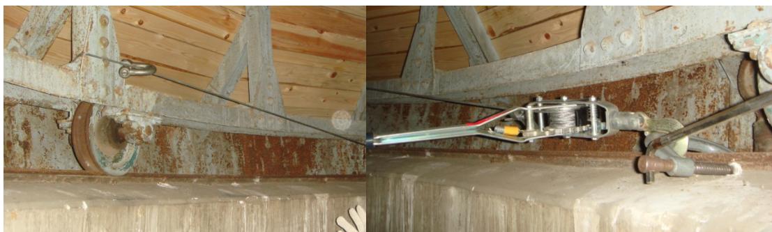
写真 4 パワーウインチを使って引っ張る

ほぼ 180 度離れた位置に 2 個のパワーウインチを配して廻そうとしたが、力一杯 3 人力でやっと廻せ始めたが、そんなに力が必要だったことの原因がワイヤーによる回転機構がうまく機能せず、この機構が壊れてからそのことに気づき、ワイヤーを完全にたるませると 1 人力でも容易に回るようになった。3 人力でワイヤーによる回転機構のプーリーの 1 個を支える心棒の鉄棒がひん曲がって抜け落ちるといふ、この機構を壊したことになったがドームは西に向いた。これでスリットを 2 枚の扉として開閉できるようにする工事に進めることになった。写真 5 が左右 2 個のプーリーの 1 個が抜け落ちた様子と抜け落ちた 1 個のプーリーである。抜け落ちた直後のプーリーの様子はバタバタしていて写真を撮り損ねたが写真 5 の右側の心棒がひん曲がっていた。このような作業には記録班が必要であることを実感した。写真 6 はワイヤーが収まる溝である。