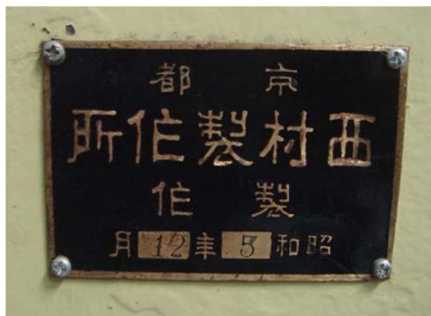
写真 5 西村製作所の名盤

写真 1 の赤道儀のコラムは 2 段に繋がれており、川崎青少年科学館に存在する赤道儀は、その上段部分と思われる。射場観測所一覧の 7 吋半屈折赤道義望遠鏡の欄には機械部分は西村製作所製であると書かれており、川崎青少年科学館の赤道儀のコラムには写真 5 の名盤が付いていた。