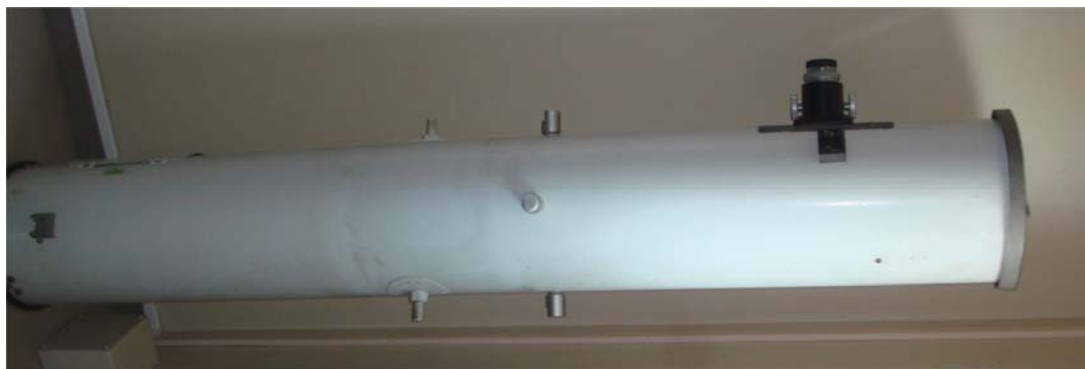
写真 4 載っていた 20 cm 反射望遠鏡

写真 2 がドイツ式赤道儀のコラム部分であり、写真 3 が赤経赤緯軸及び望遠鏡取付台部分である。この赤道儀には 20 cm 反射望遠鏡(写真 4)が載せられていたようで、川崎に持ち込まれた時点で 7 吋半の屈折望遠鏡はなかったようである。この赤道儀に 20 cm 反射望遠鏡が載せられた状態で川崎青少年科学館に川崎天文同好会の箕輪敏行氏により寄贈され、現在、川崎市の文化財に登録されているとのことであった。箕輪敏行氏ご自身が東京天文台の富田弘一郎氏から譲り受けたと話されていたことから、この赤道儀が射場天体観測所から東京天文台に寄贈されたものの一部であることは確かなようである。