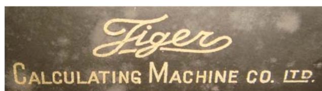
写真 2 タイガー計算機の名盤

タイガー計算機は、日本では大正時代に大本寅治郎によってこの型の計算機が開発され、その商標「タイガー計算器」はこの種の計算機の代名詞にもなっていたが、東京天文台には他のメーカーのものもあった。しかし機械式手回し計算機と言え、ば、「タイガー」と呼んでいた。ところが今回収蔵した手回し計算機は「タイガー計算機」にそっくりではある