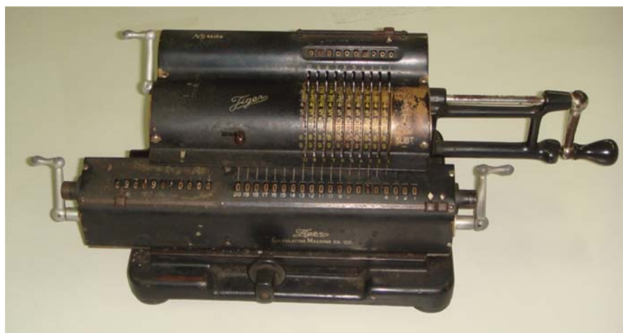
写真 1 タイガー計算機

これらの天文計算に一時期大活躍をしたのが手回し機械式計算機である。通常東京天文台の人間はそれらを「タイガー計算機」（写真 1）と呼んでいた。その名盤が写真 2 である。