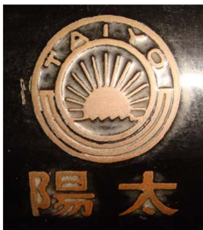
写真5 「太陽計算機の名盤」